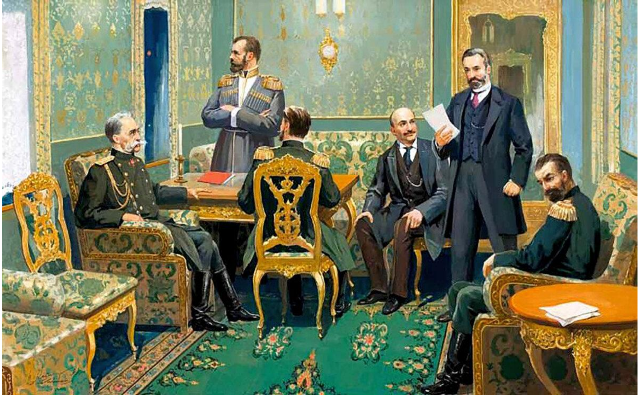
2 марта 1917 г. Николай II отрёкся от престола