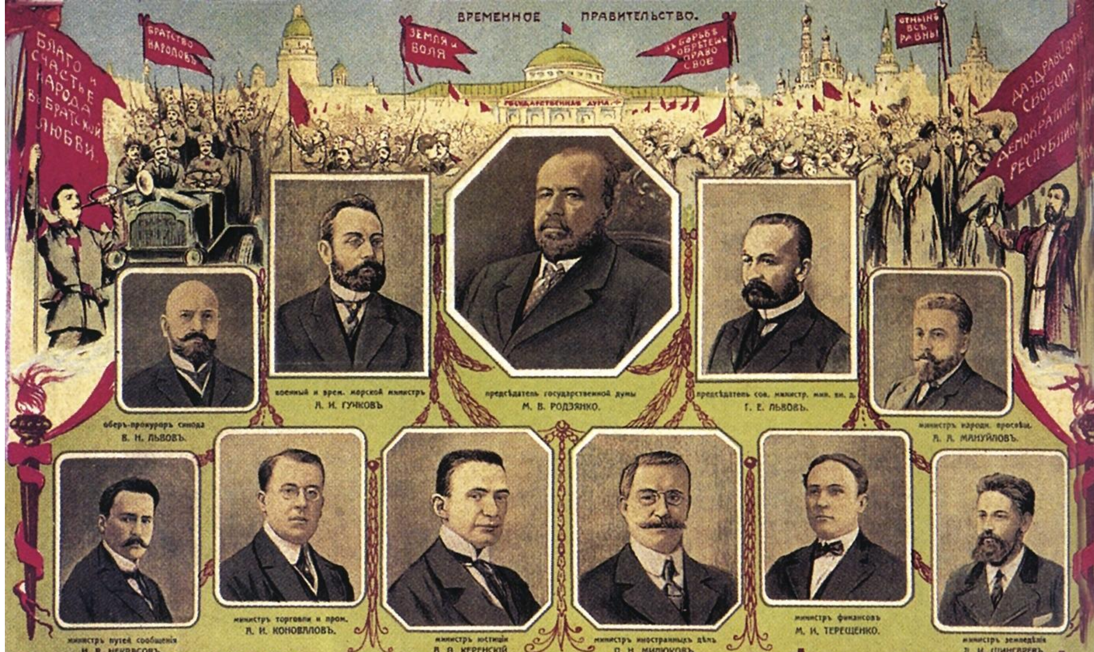
Временное правительство. Александр Фёдорович Керенский