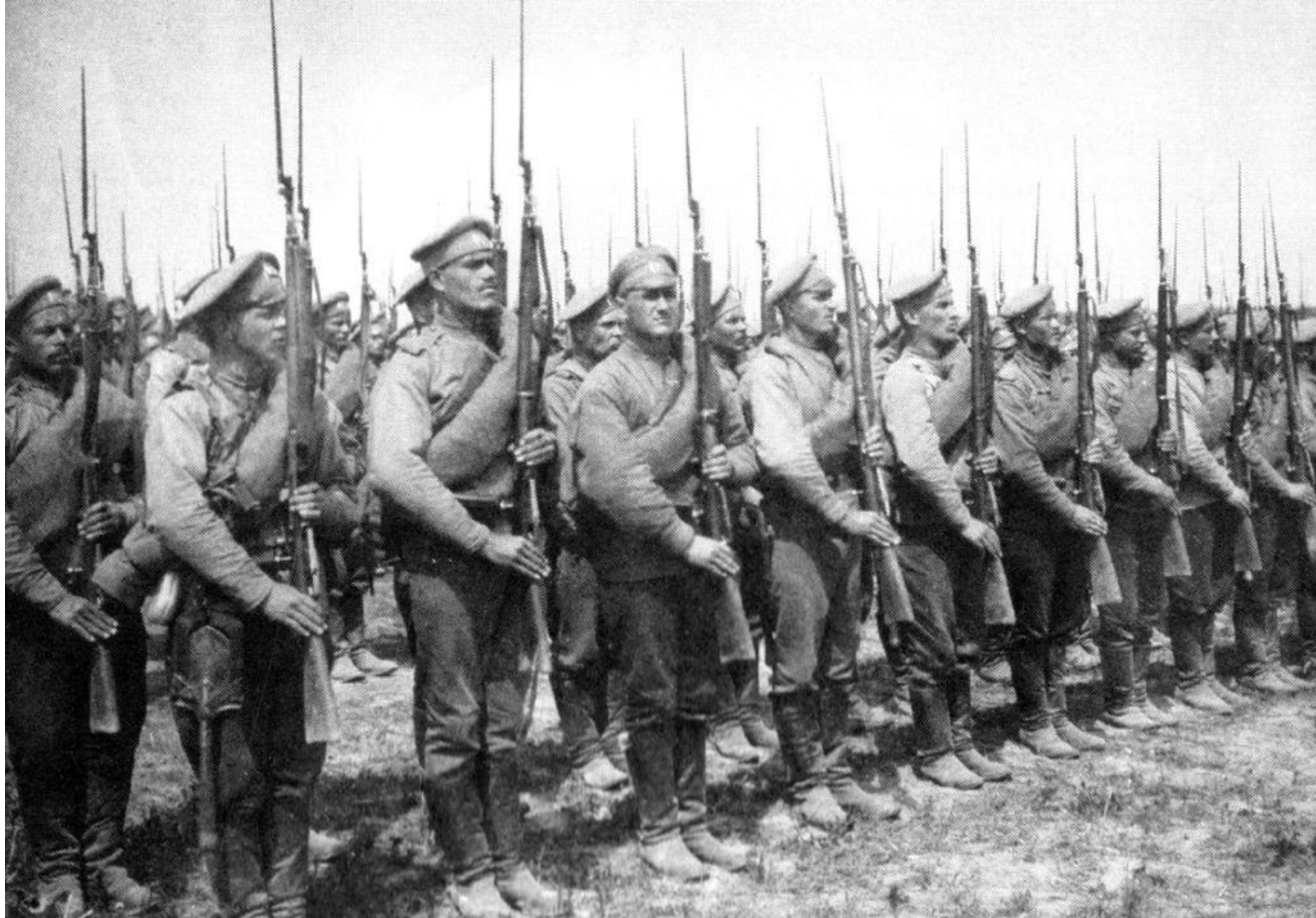
Первая мировая война, 1914 г.