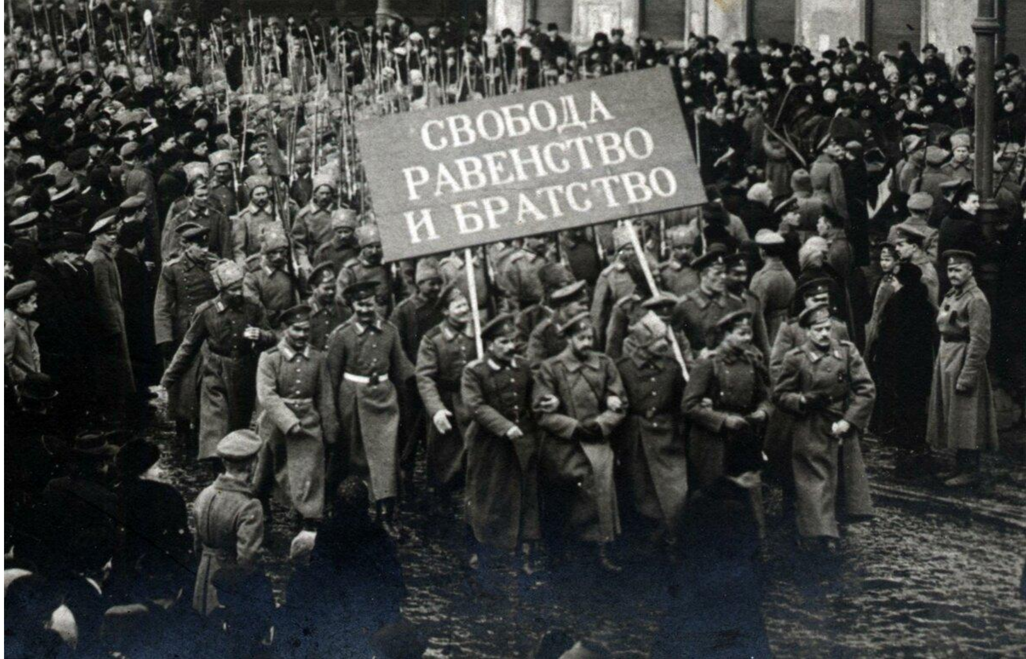
Февральская революция 1917