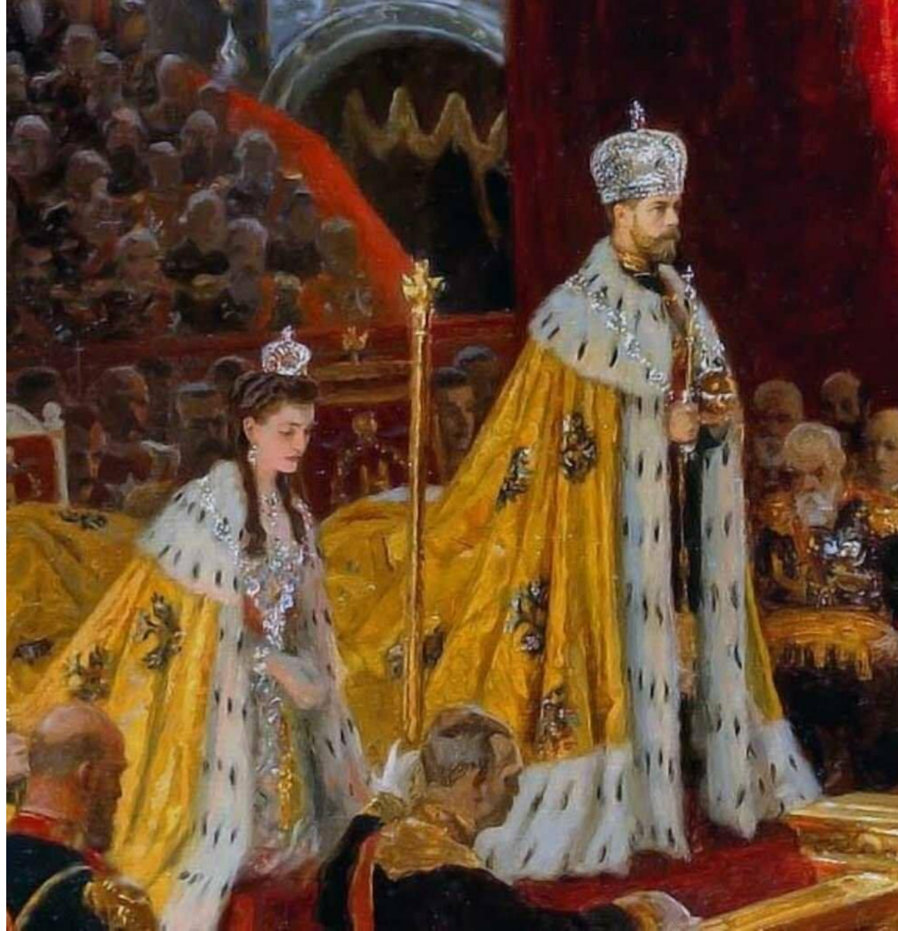
Коронация Николая II состоялась 26 мая 1896 года.