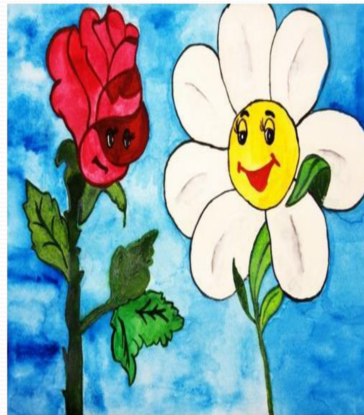
Басня «Ромашка и Роза»