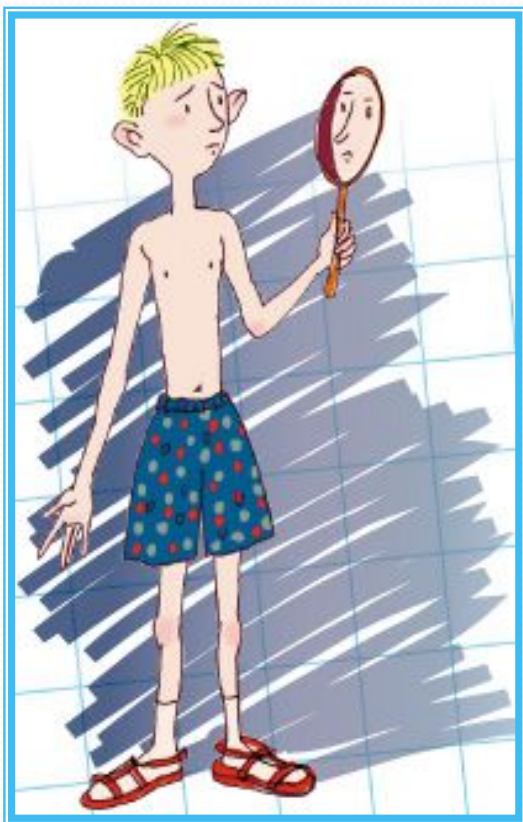
Притча «Мальчик и зеркало»