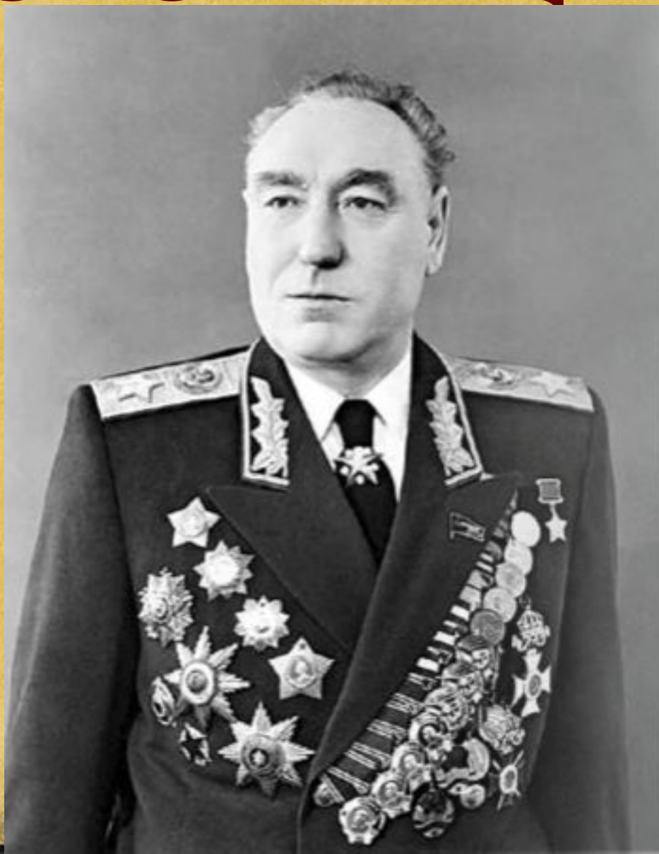
Бирюзов Сергей Семенович