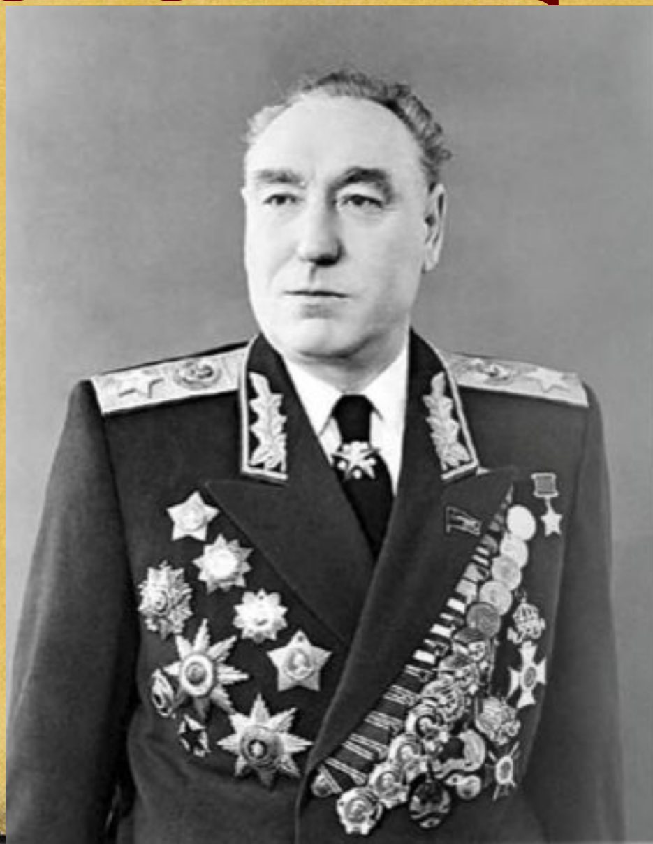
Бирюзов Сергей Семенович