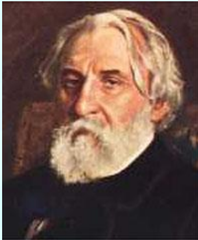
Иван Сергеевич Тургенев

Любовь, думал я, сильнее смерти и страха смерти. Только ею, только любовью держится и движется ЖИЗНЬ.