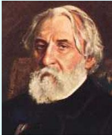
Иван Сергеевич Тургенев

Только ею, только любовью держится и движется жизнь.