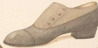
Anglaise, vers 1900-1906