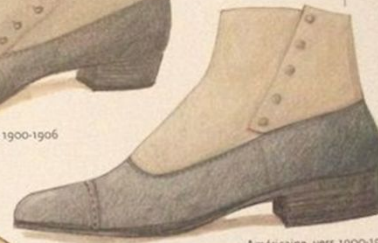
Américaine, vers 1900-1909