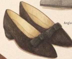
Anglaises, vers 1905-1909