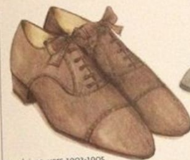
Anglaises, vers 1903-1905