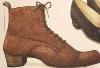
Américaine, vers 1905