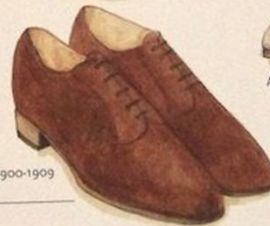
Anglaises, vers 1900-1909