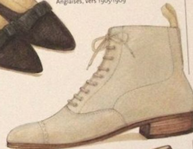
Anglaise, vers 1900-1909