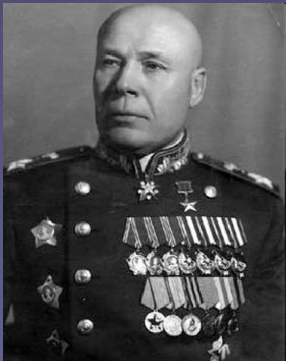
Тимошенко, Семён Константинович

1) Юго-Западный фронт: создан 25 октября 1942 года в составе 21, 63 (1-я гвардейская, затем 3-я гвардейская), 5-й танковой и 17-й воздушной армий. В последующем в его состав входили 5-я ударная, 6, 12, 46, 57, 62 (8-я гвардейская), 3-я танковая и 2-я воздушная армии