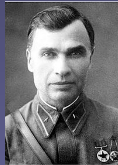
Кирпонос, Михаил Петрович