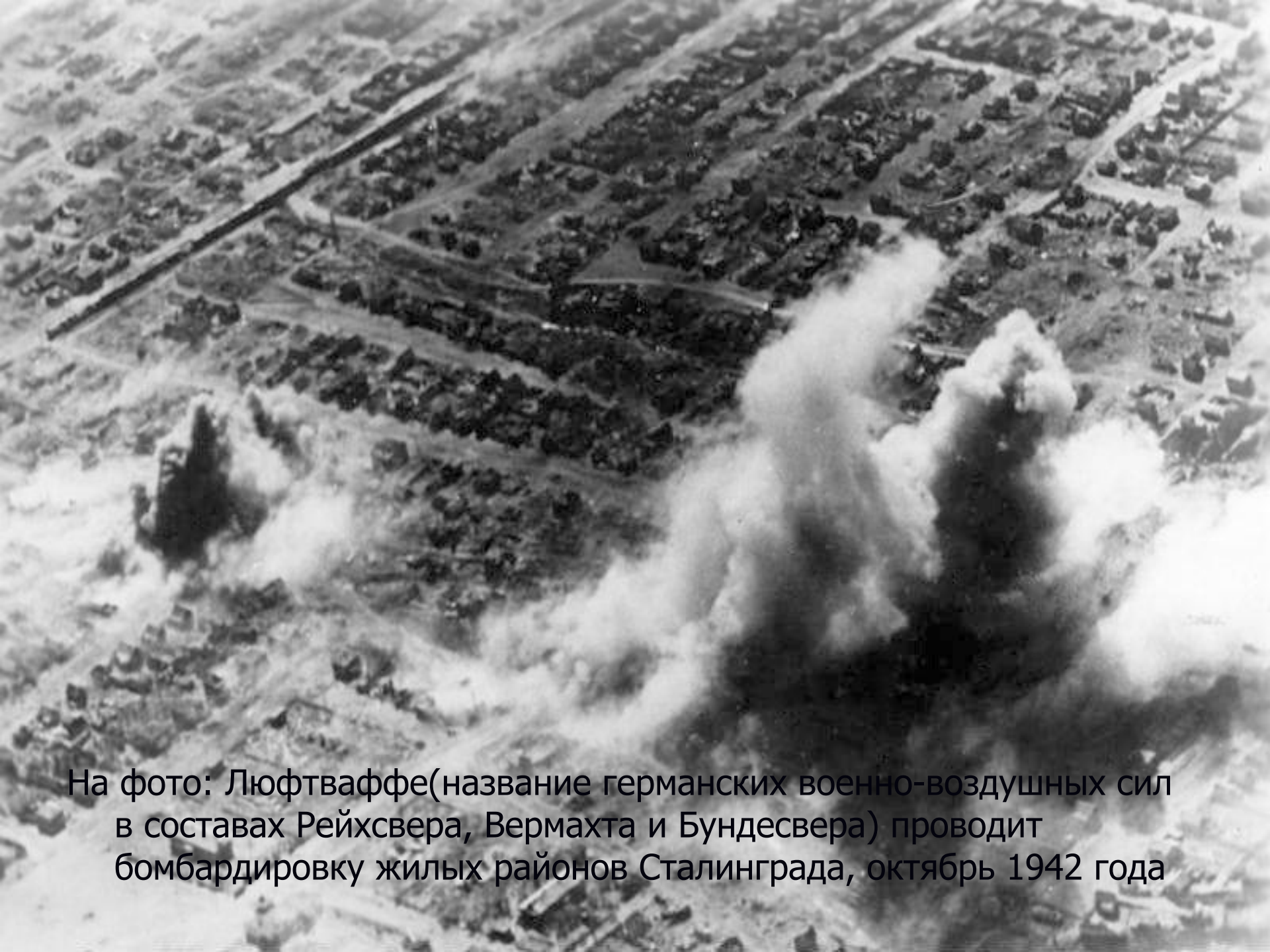
На фото: Люфтваффе(название германских военно-воздушных сил в составах Рейхсвера, Вермахта и Бундесвера) проводит бомбардировку жилых районов Сталинграда, октябрь 1942 года