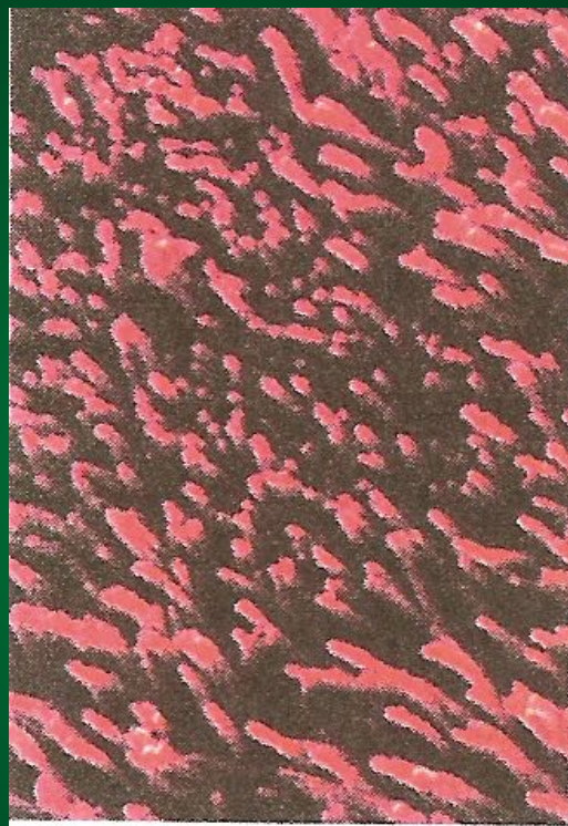
Поверхность легких некурящего человека

Курение – одна из наиболее распространенных вредных привычек. В развитых странах сигареты являются причиной свыше 20% смертей.