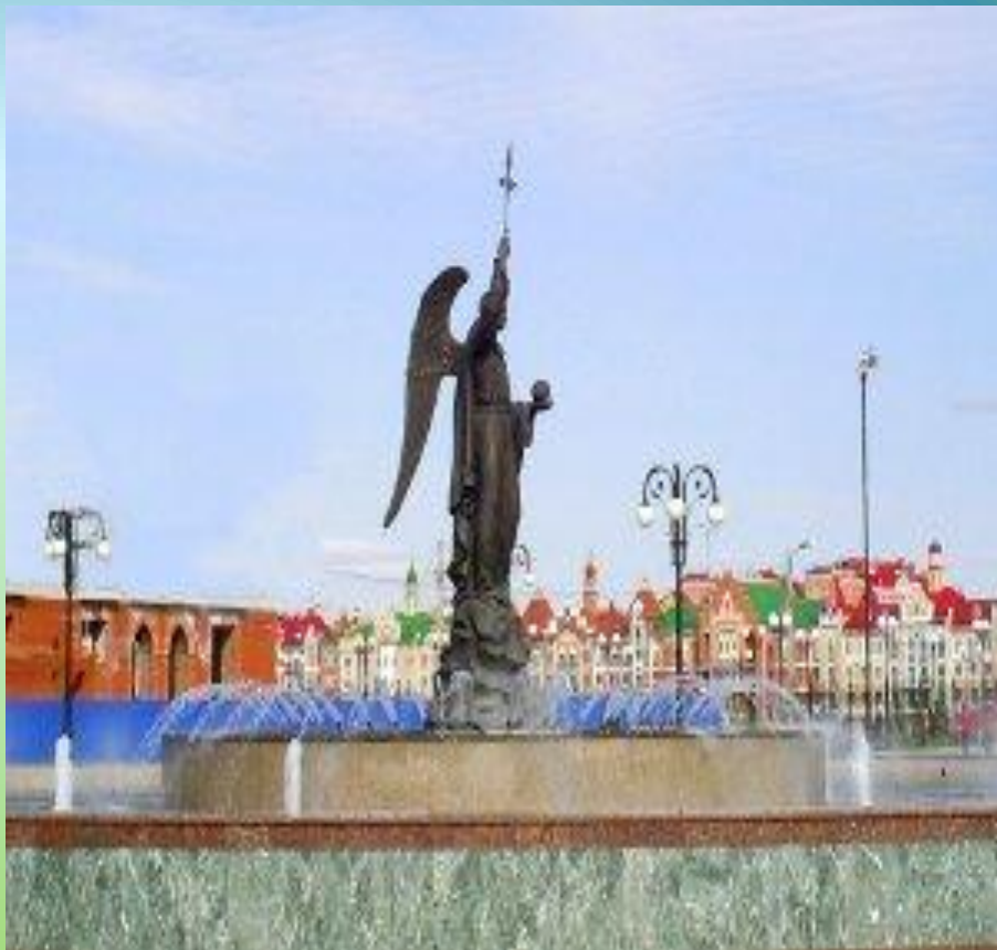
14. Фонтан "Архангел Гавриил".