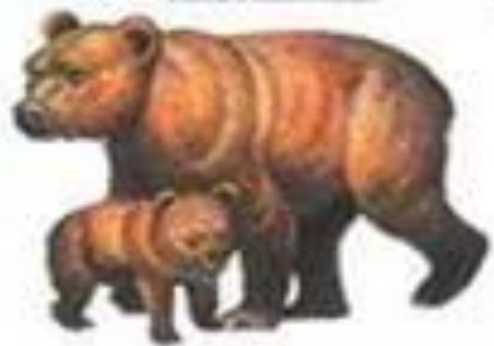
Медведица с медвежонком