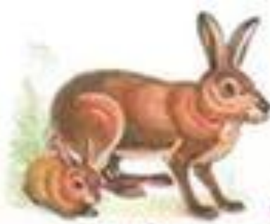
Зайка с зайчатами