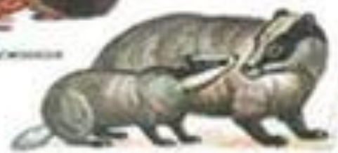
Барсук с барсучатами