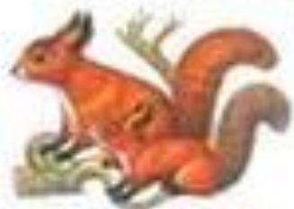
Белка с белками