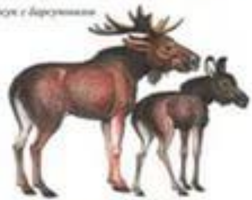
Олень с оленятами