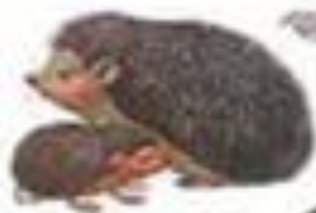
Ёж с ёжатами