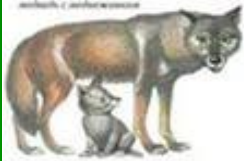
Волк с волчатами