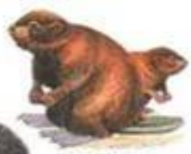
Белица с белками