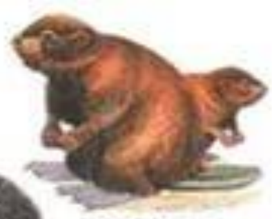
Медведь с медвежонком