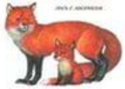
Лиса с лисятами