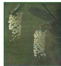
Черемуха Сьори (айнская)