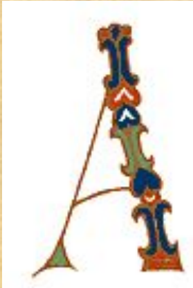
А з ъ