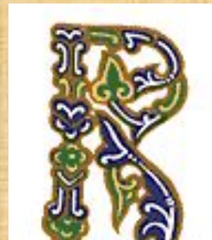
В е д и