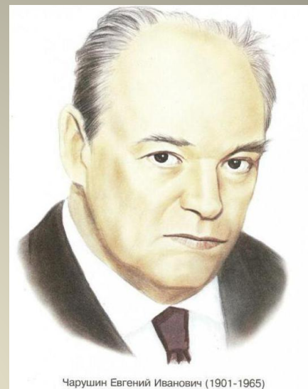
Чарушин Евгений Иванович (1901-1965)