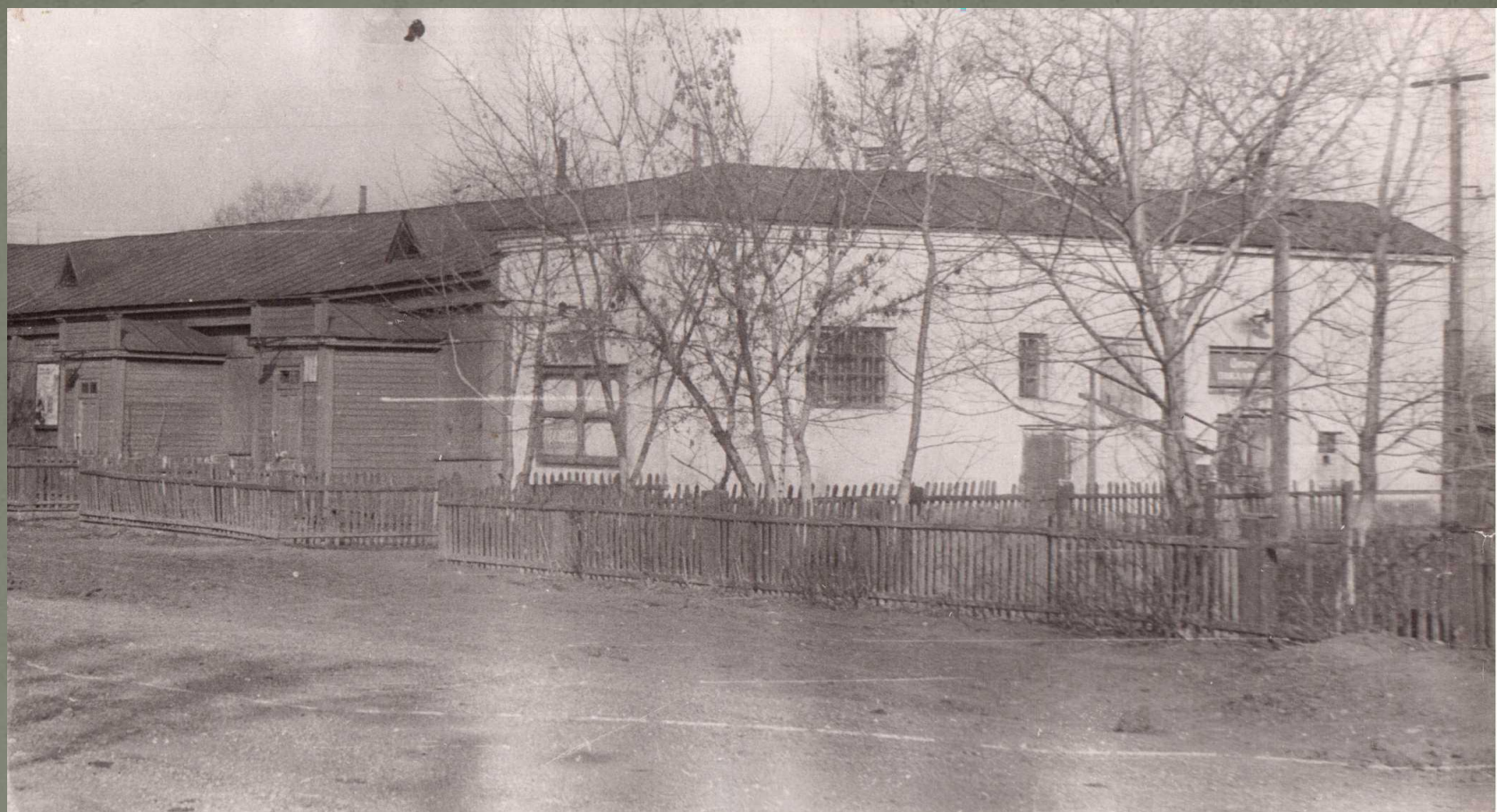
Подмости сцены в здании железнодорожного клуба имени И. Сталина на улице Кооперативной.