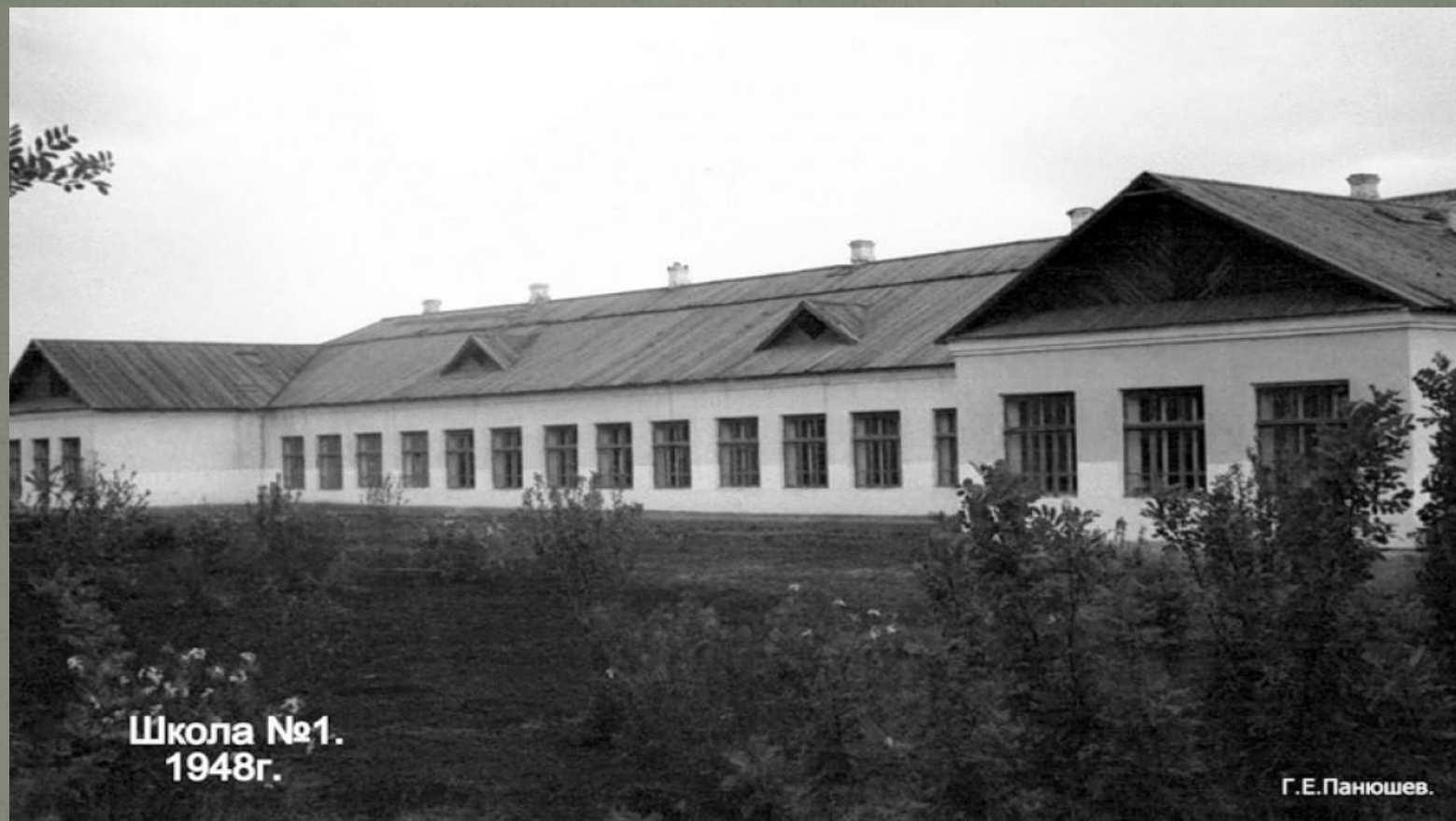
Школа №1. 1948г.