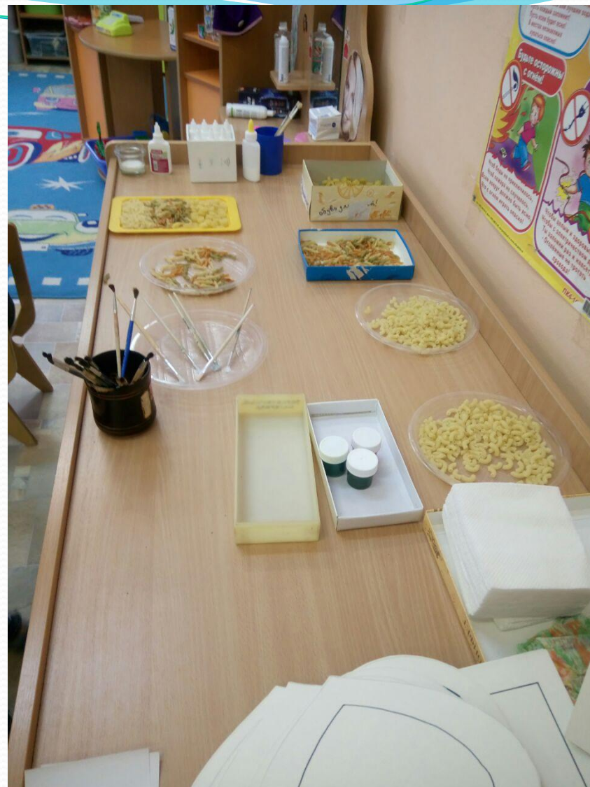
МАСТЕРСКАЯ - ДИЗАЙНЕР