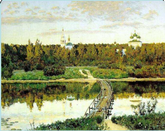
Исаак Левитан Тихая обитель