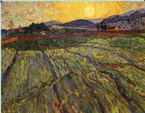
Винсент Ван Гог Огороженное поле