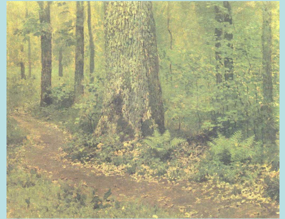
Исаак Левитан Тропинка в лиственном лесу