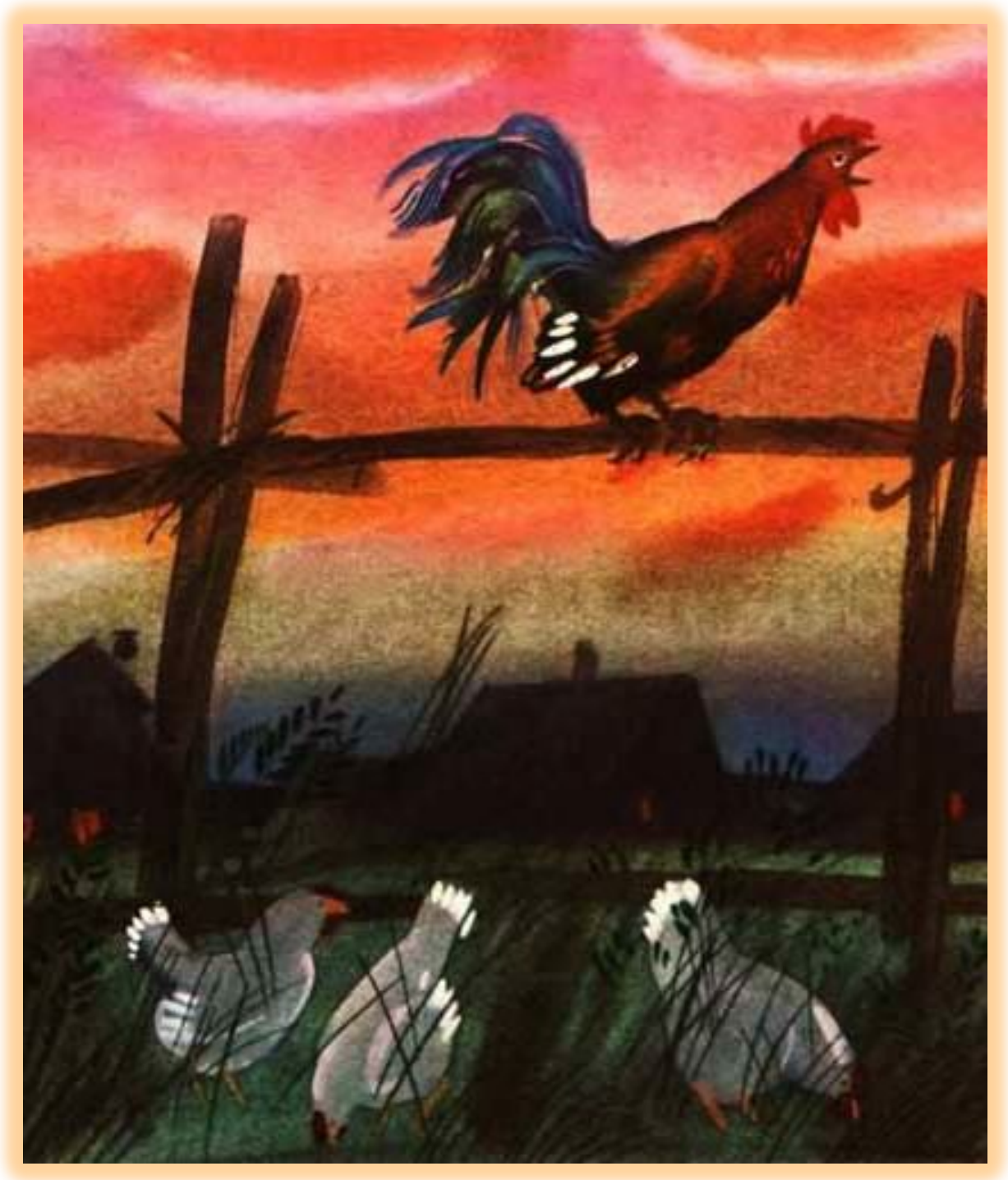
Третий луч солнца