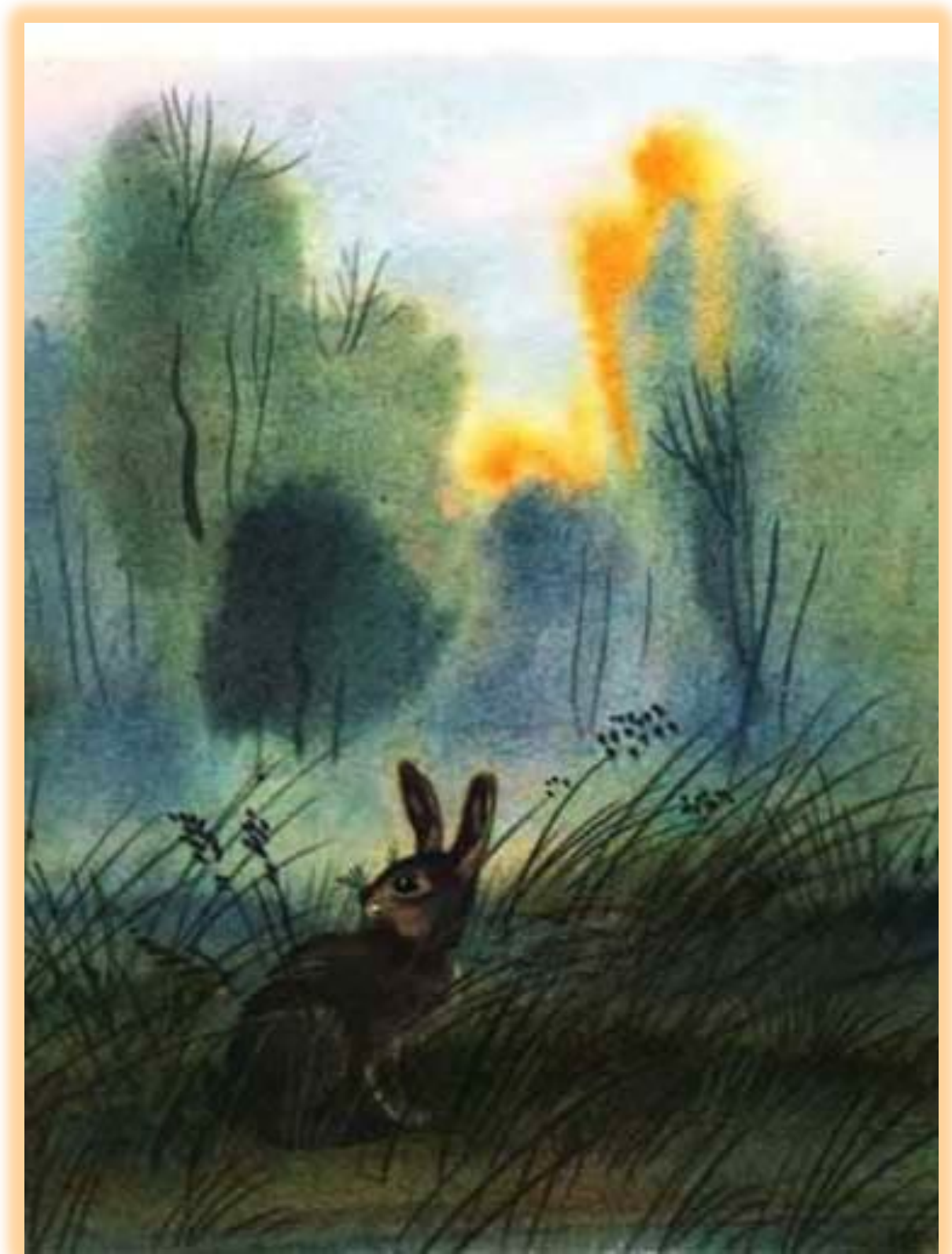
Второй луч солнца