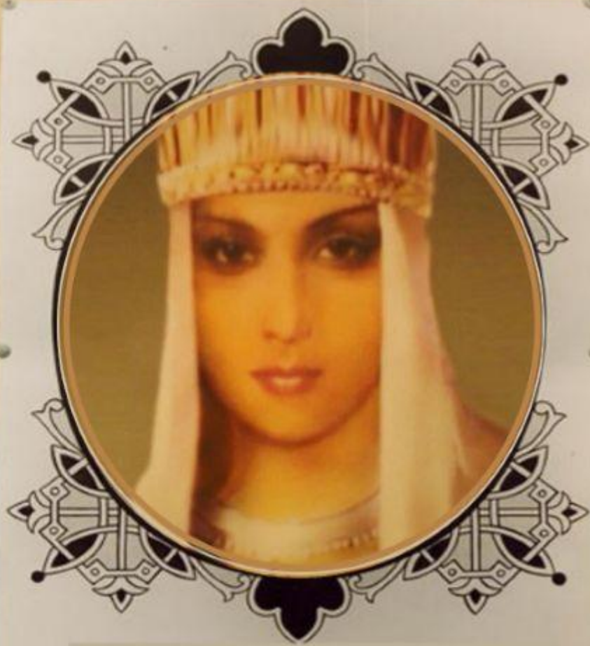
Царица Мария Темрюковна