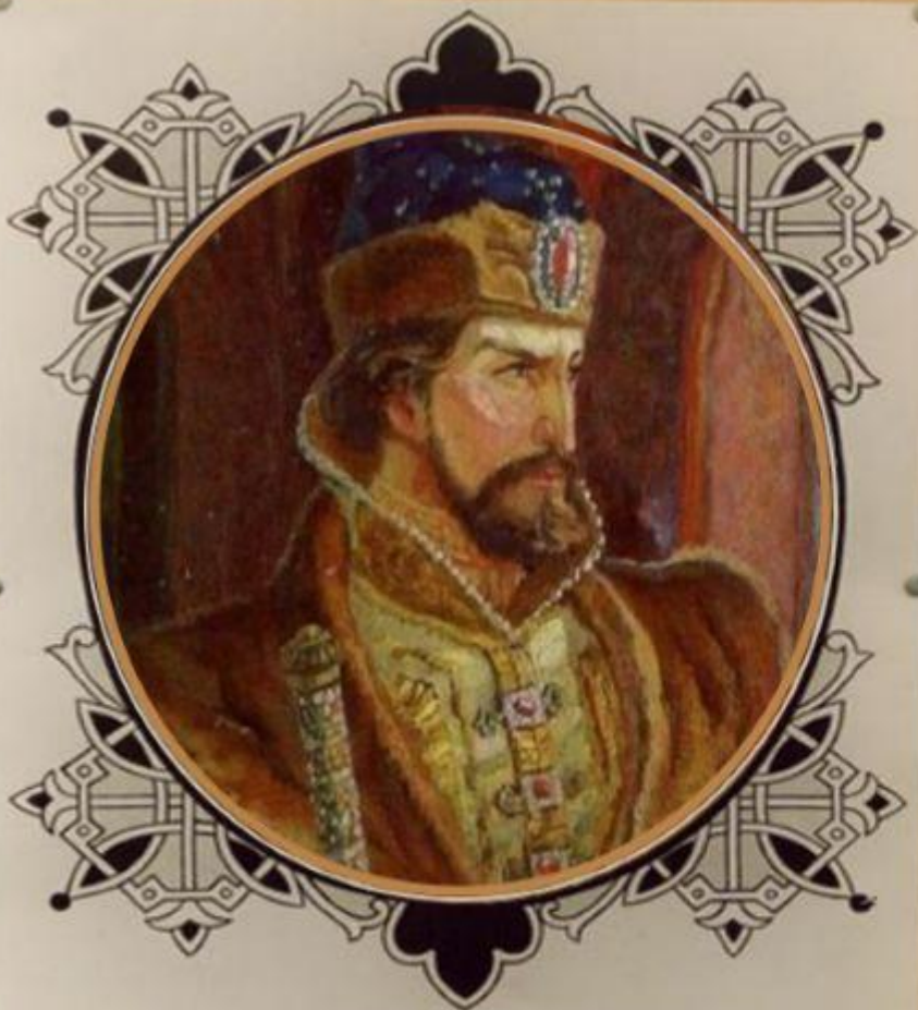
Царь Иоанн IV Васильевич