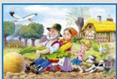
Дидактическая игра «Угадай сказку»