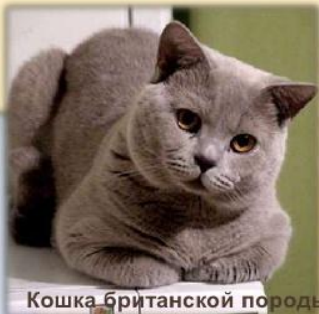
Кошка британской породы