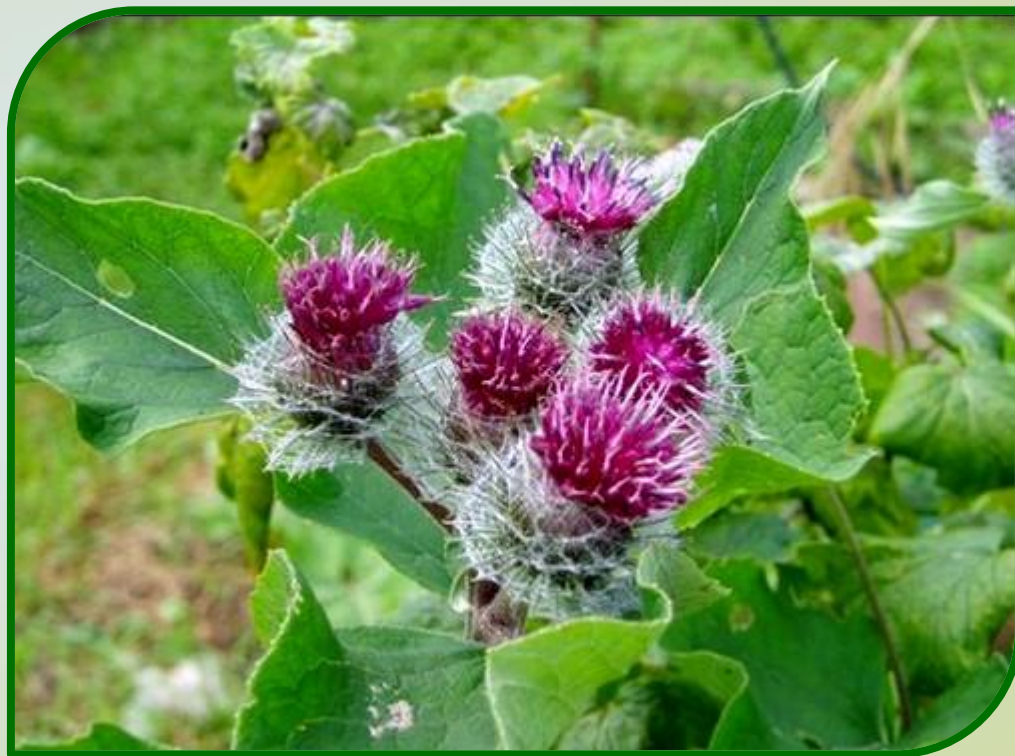
Репейник, или лопух