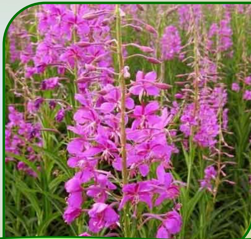
Кипрей, или иван-чай