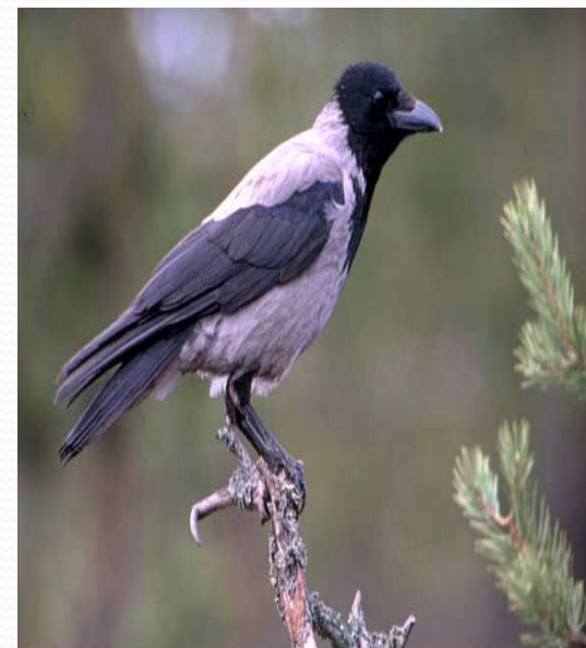
Ворона серая - Corvus cornix