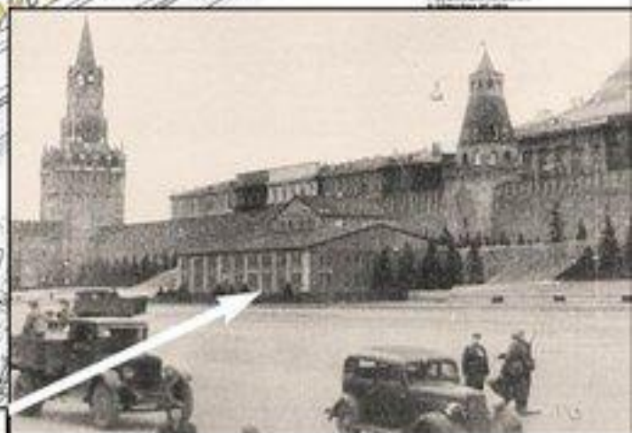
Схема и снимки из книги «Московский Кремль в годы Великой Отечественной войны». Публикуются впервые.

Мавзолей Ленина спрятали внутри двухэтажного деревянного здания.