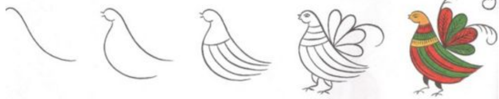
Виды пермогорских птиц