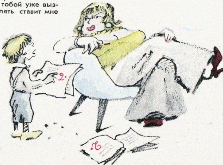
Рисунок В. ГАЛЬБА

— Мама, учитель после разговора с тобой уже выздоровел и опять ставит мне двойки!