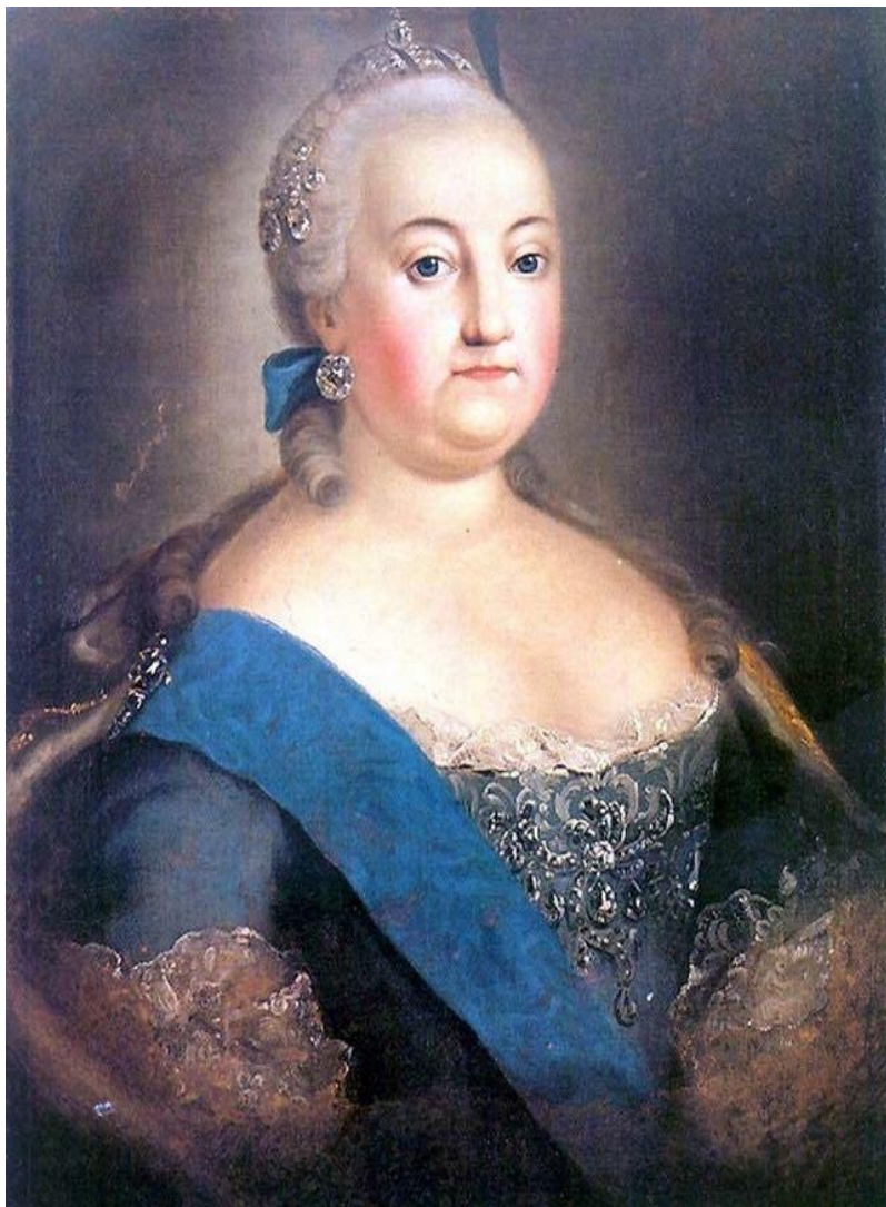
Императрица Елизавета Петровна