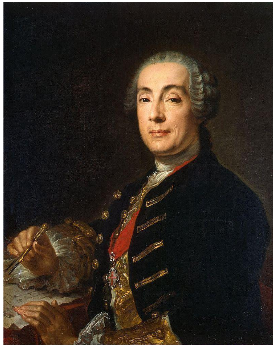
Франческо Бартоломео Растрелли