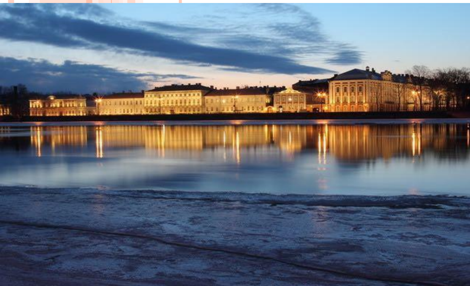
Набережная реки Невы