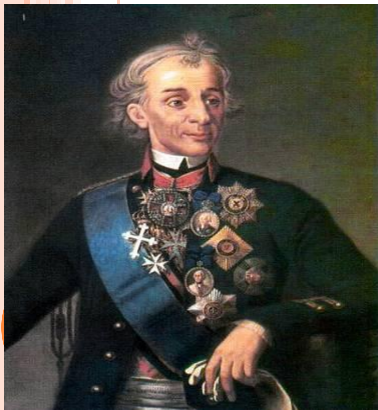
Суворов Александр Васильевич