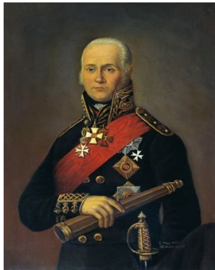
Ушаков Фёдор Фёдорович