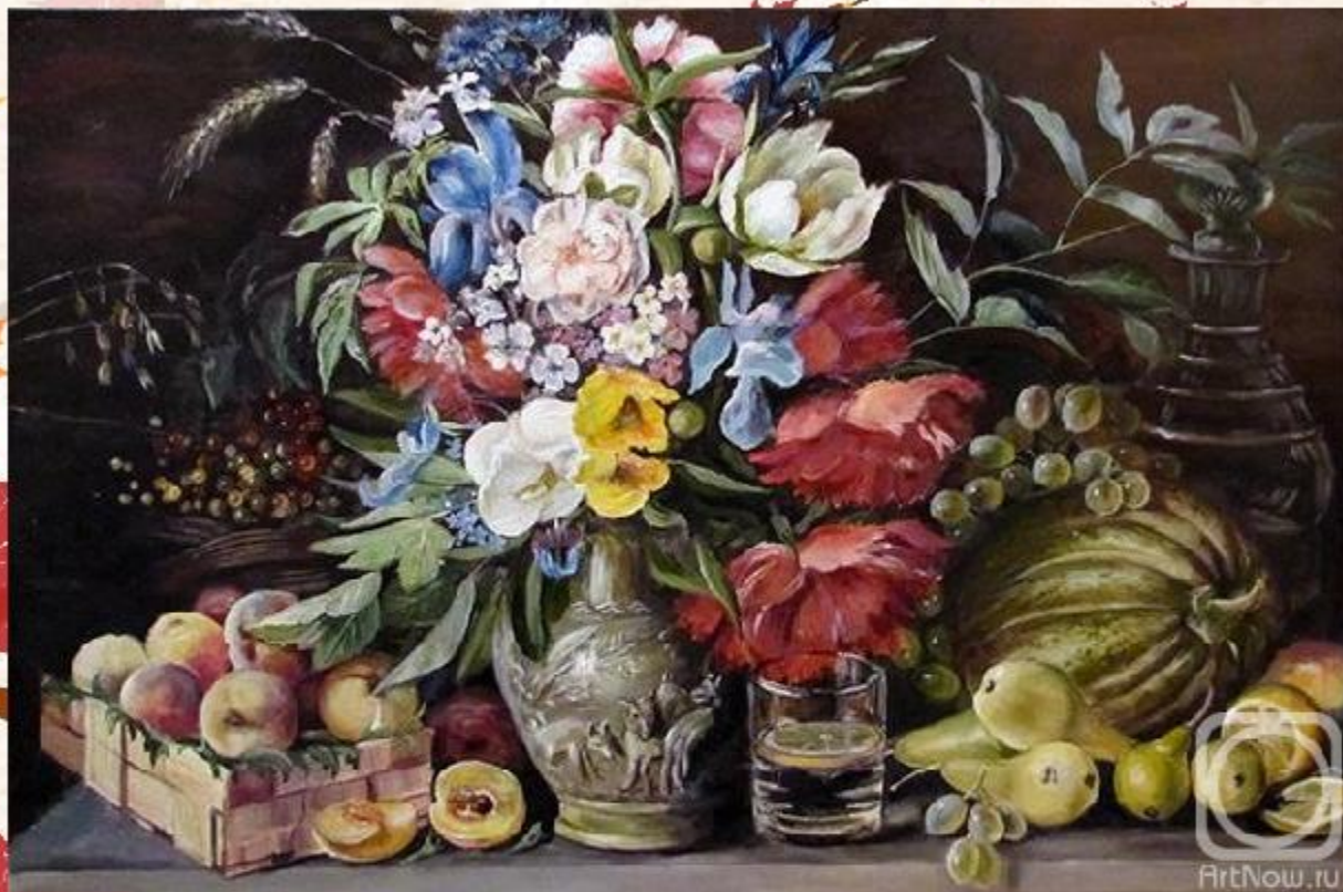
«Цветы и плоды» художника Ивана Трефиловича Хруцкого.

Все предметы в картине И.Т. Хруцкого подобраны очень продуманно. Расположив их вдоль края мраморного стола и подчеркнув светом передний план, художник сразу же наметил зрительный центр картины. Это ваза с цветами. В богатом по краскам подборе явно преобладают цветы светлой окраски, особенно желтые. Желтый цвет преобладает внизу по краям и вверху в центре.