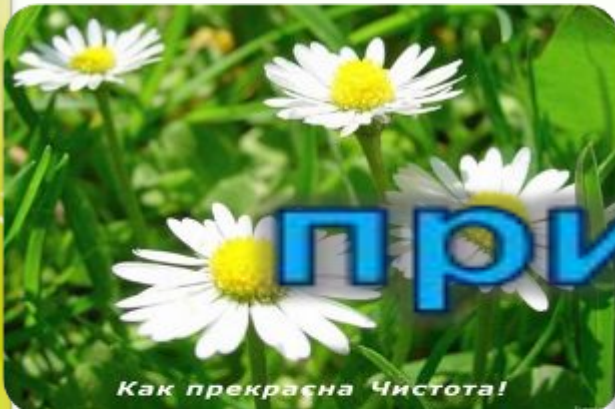
Как прекрасна Чистота!