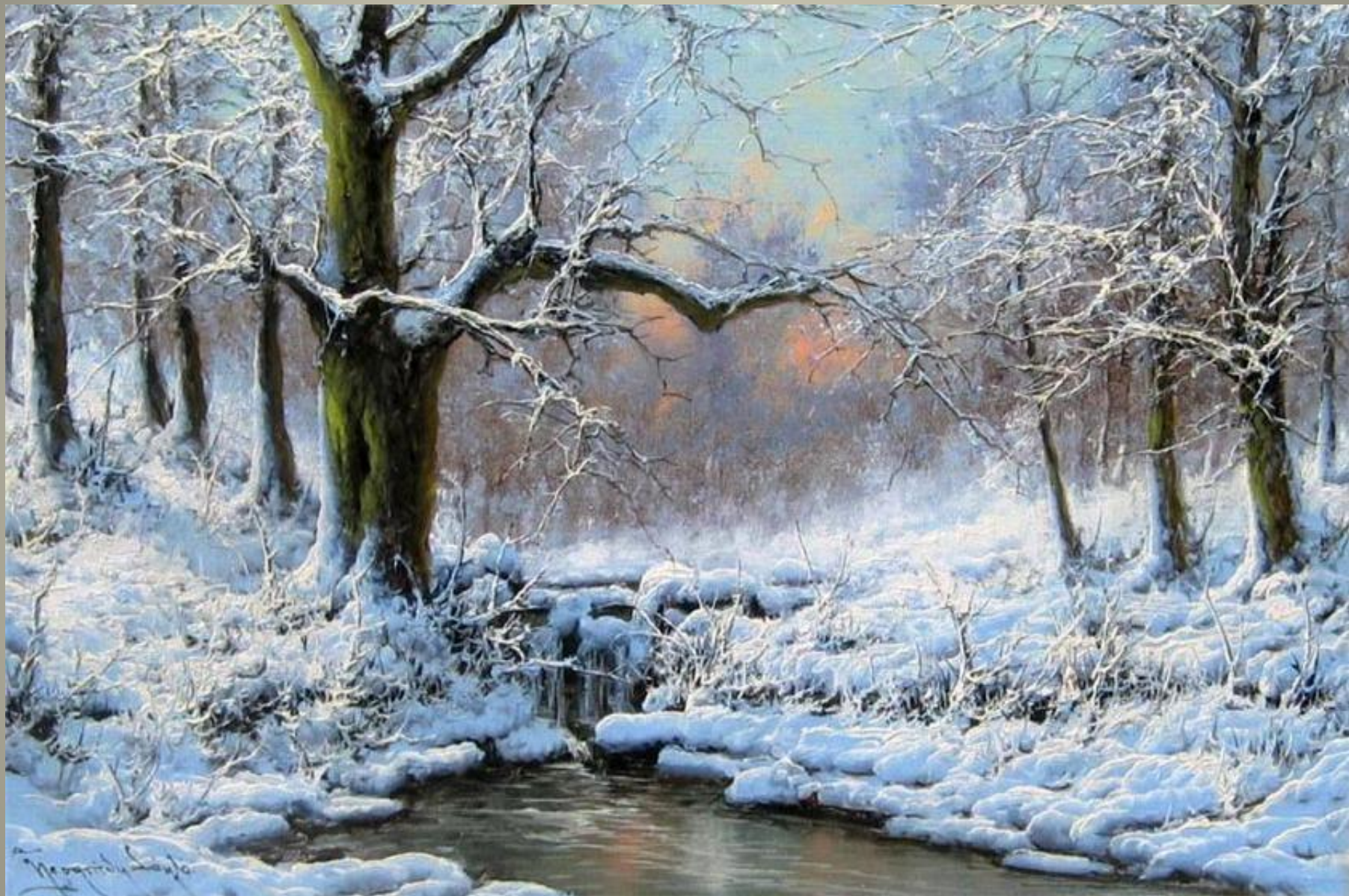
Laszlo Neogrady 1896 – 1962 «Зимние пейзажи»