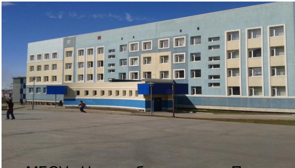
МБОУ «Центр образования»г.Певек