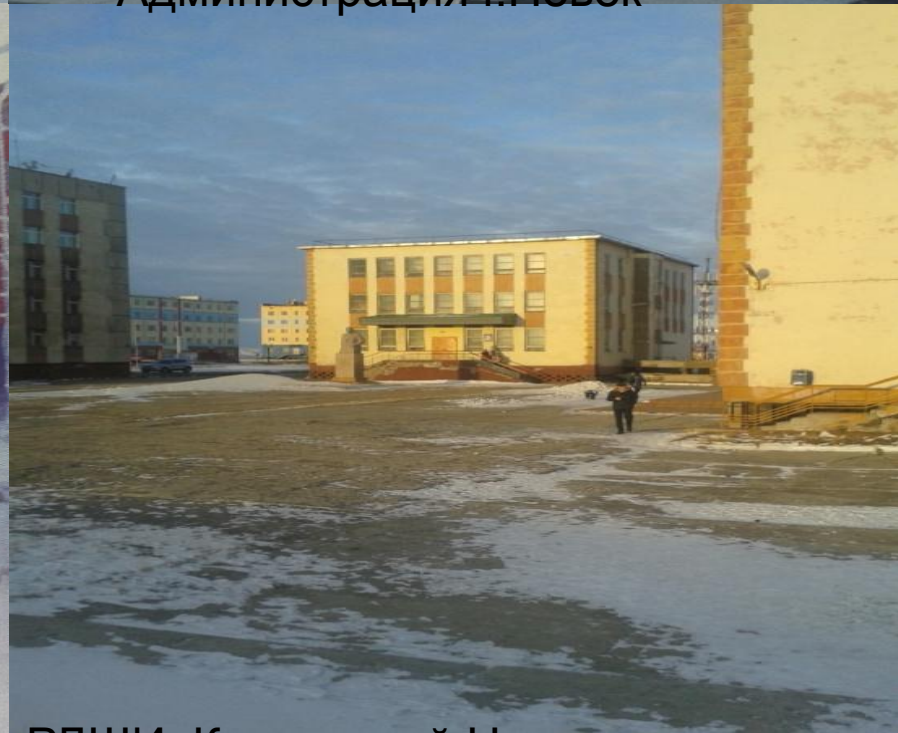
РДШИ Культурный Центр города