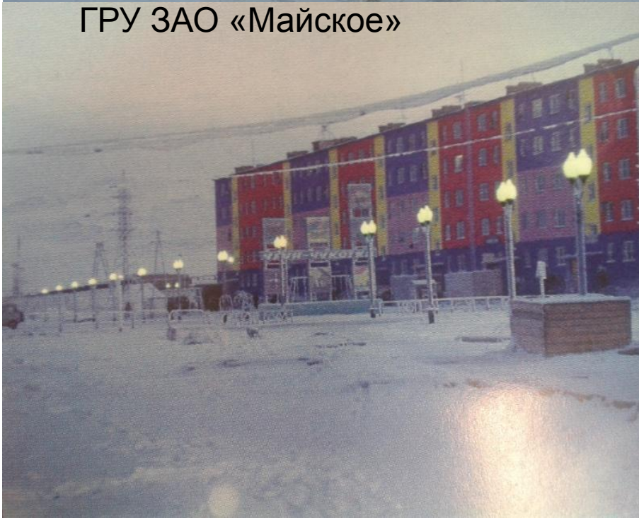
Улице Обрудова Китайская стена