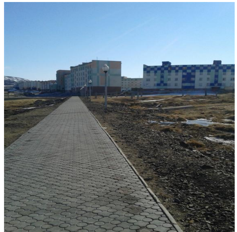
Аллея « Дружбы»