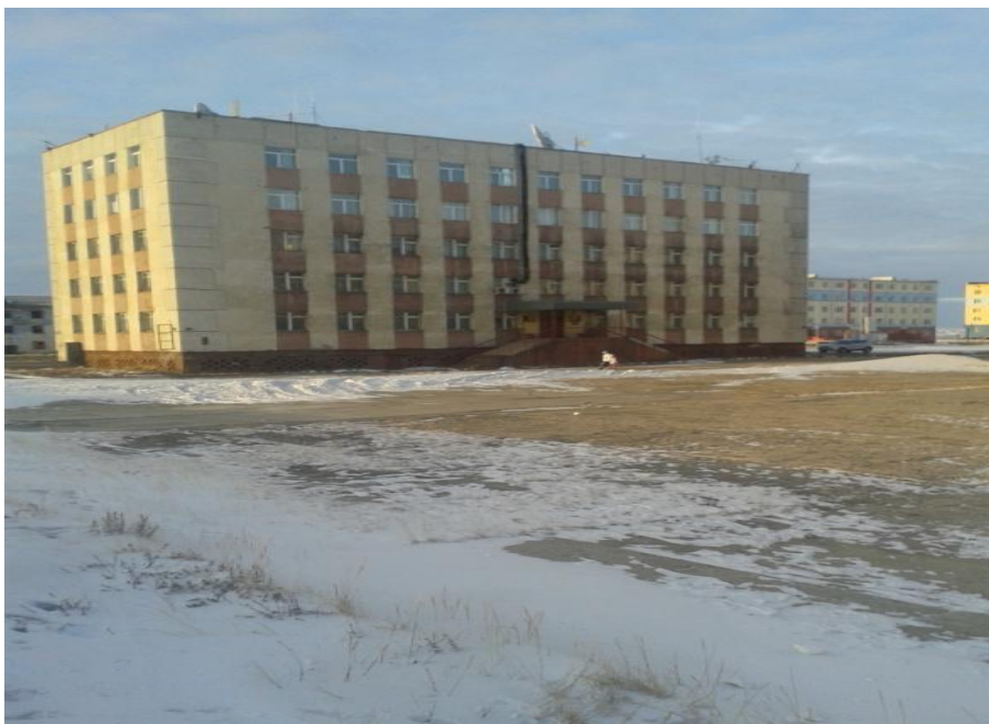
ГРУ ЗАО «Майское»