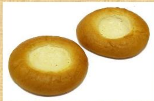
Сдоба с начинкой