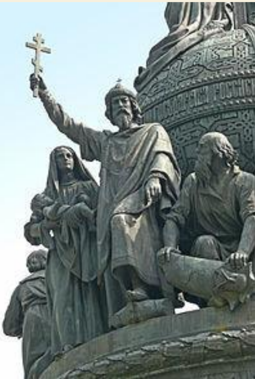
Владимир Святославич на памятнике «1000- летие в Великом Новгороде»

Во время своего правления Владимир расширил территорию государства, упорно боролся с печенегами, укрепил южные и юго-западные границы Руси, построил по рекам хорошо укрепленные города. Построил крепости, сигнальные башни, на которых зажигали огни, если приближался неприятель.