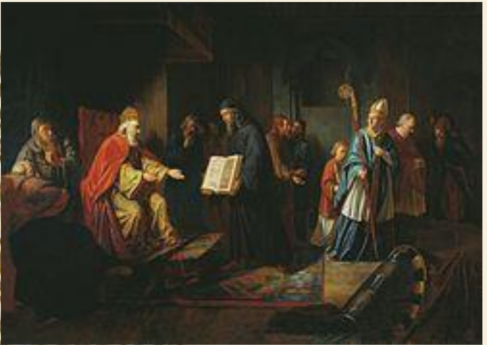
Великий князь Владимир выбирает веру. Художник И. Е.Эггинг 1822г.