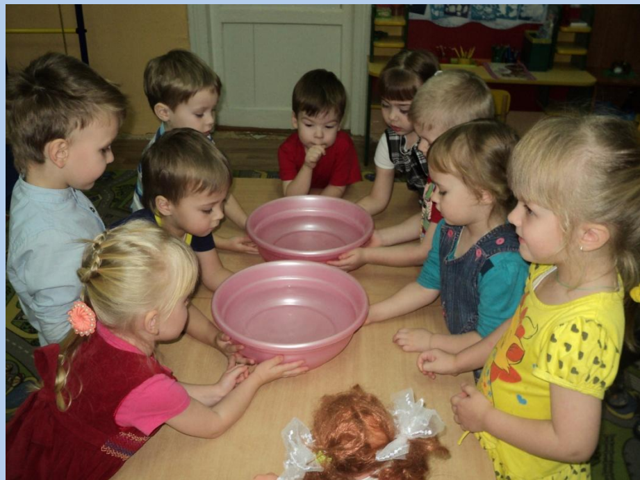
«Горячо – холодно»