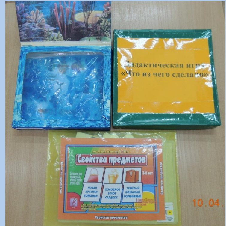
Игры и пособия по познавательному развитию