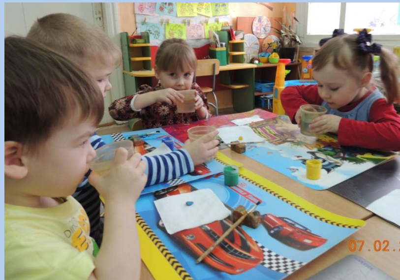
«Имеет ли запах вода?»