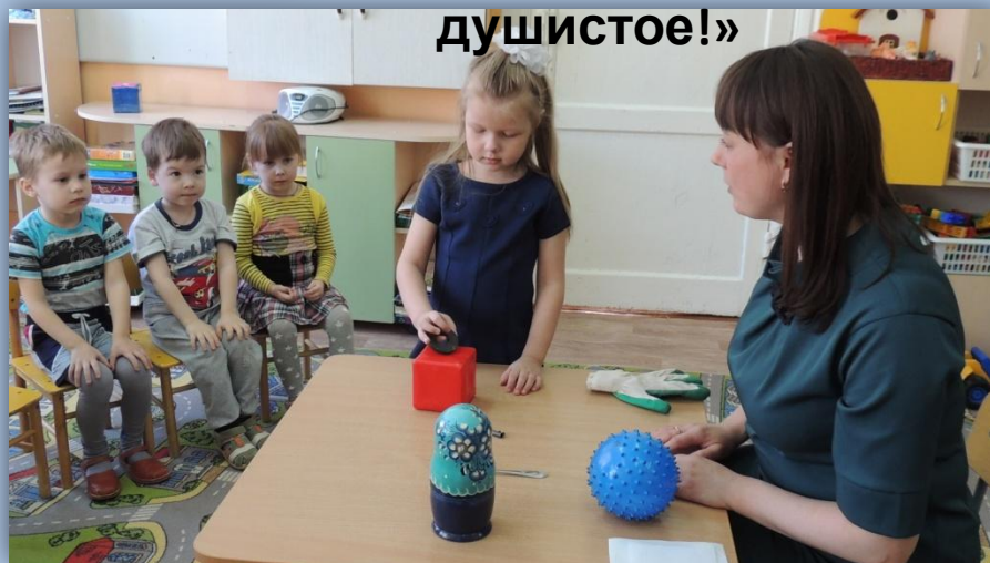
«Все ли предметы притягивает