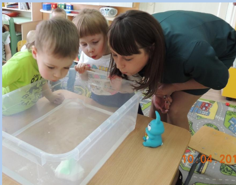
«Ты где, ветерок?»