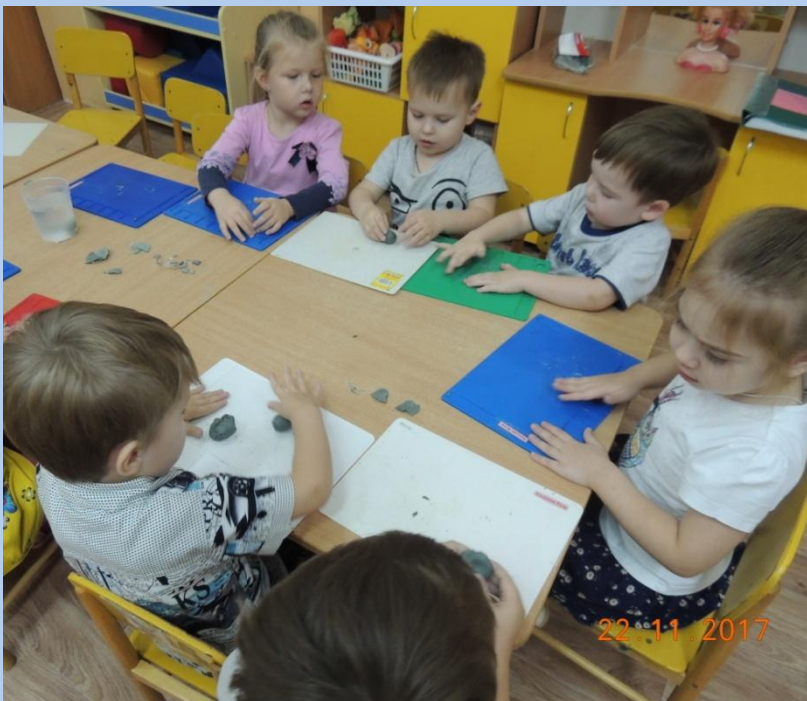
Глина: ее качества и свойства