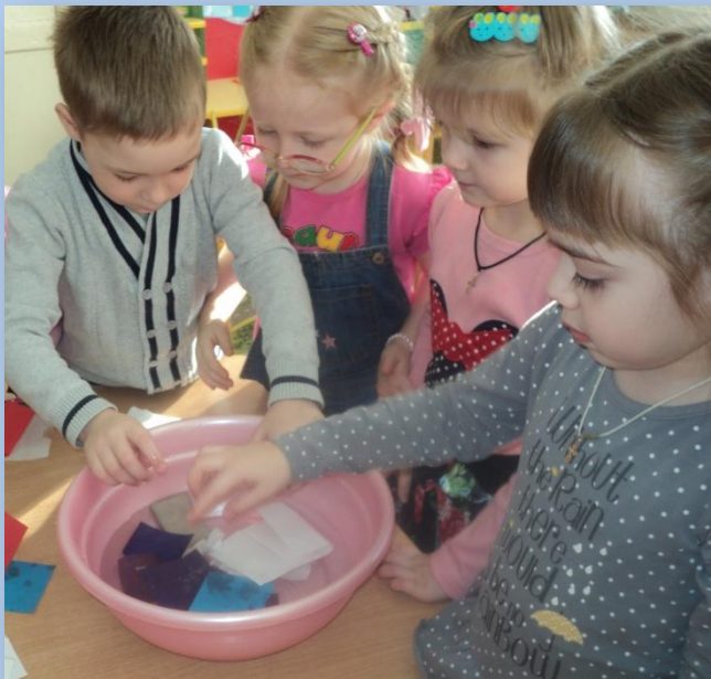
Знакомство со свойствами бумаги