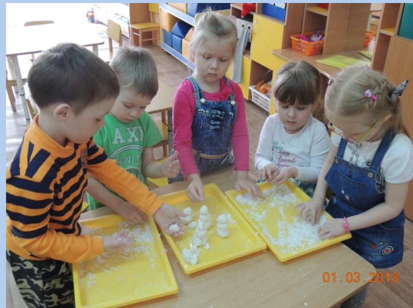
«Кто сказал, что снеговик быть на холоде привык»