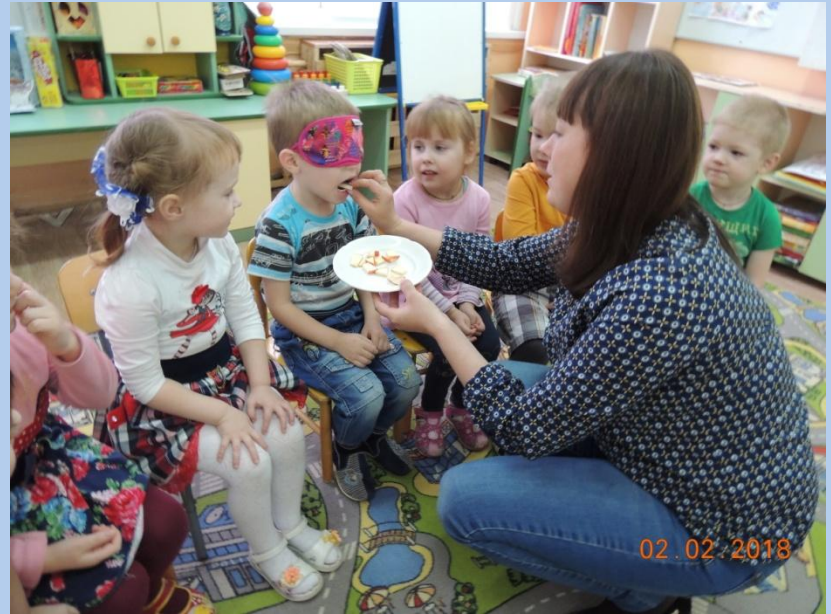
Д/и «Угадай на вкус»