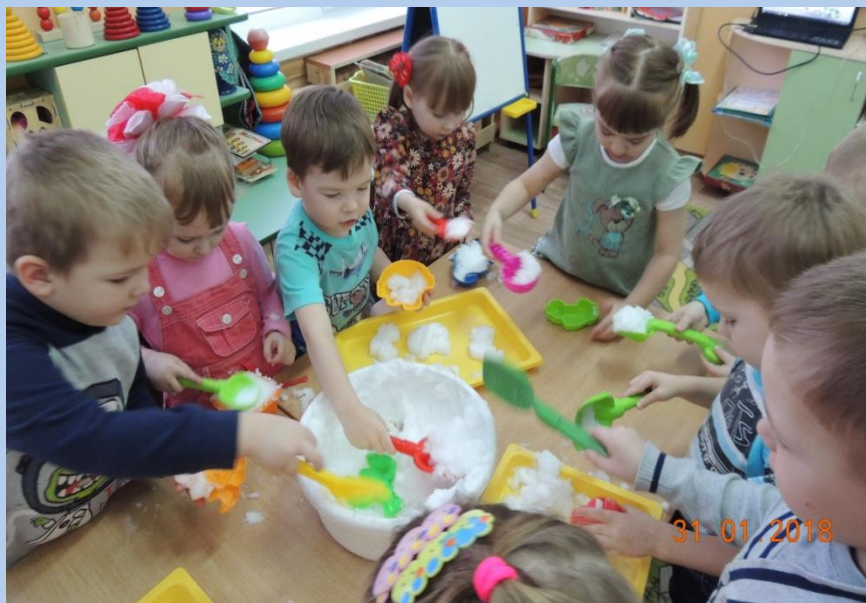
Игры со снегом