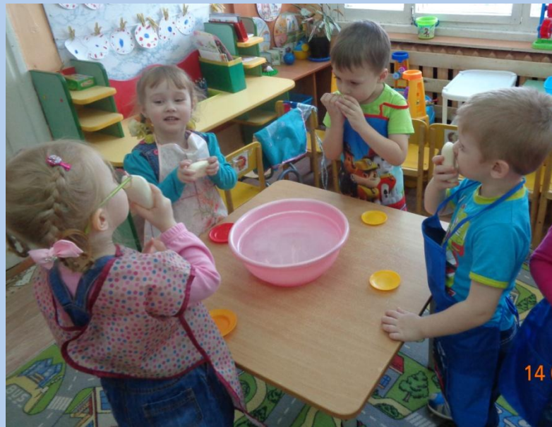
«Да здравствует мыло душистое!»