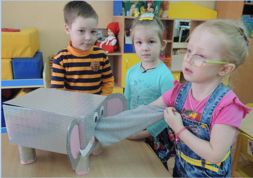
Д/и «Что в коробке»