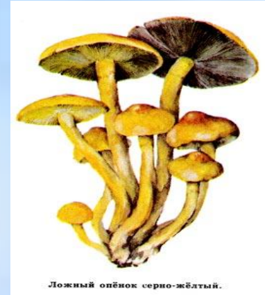
Ложный опёнок серно-жёлтый.