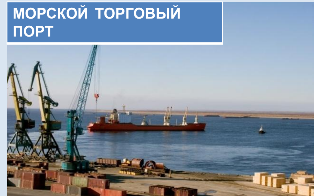
МОРСКОЙ ТОРГОВЫЙ ПОРТ