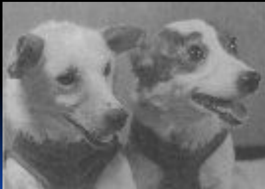
Белка и Стрелка