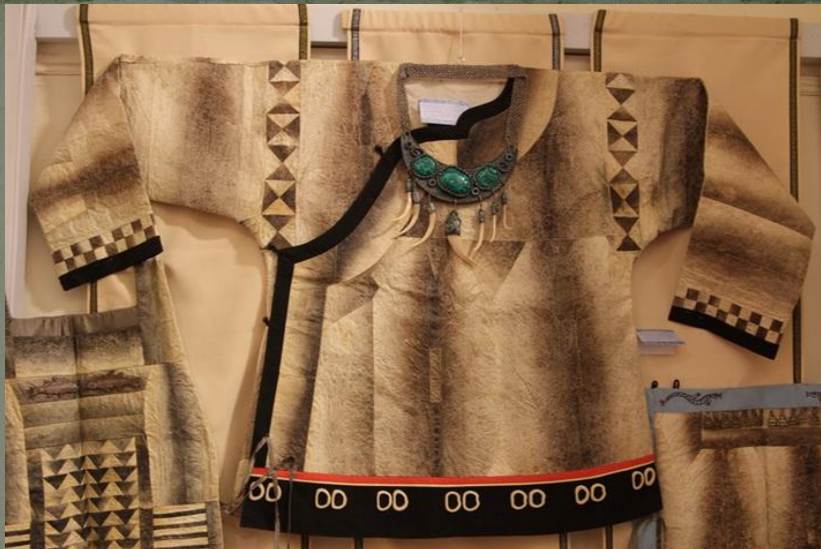
ОДЕЖДА ИЗ РЫБЬЕЙ КОЖИ