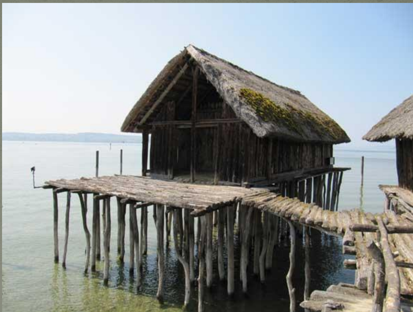
ДОМ НА СВАЯХ