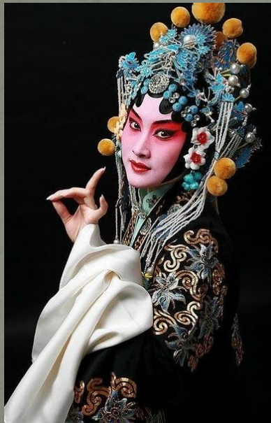
🔊 Китайская песня