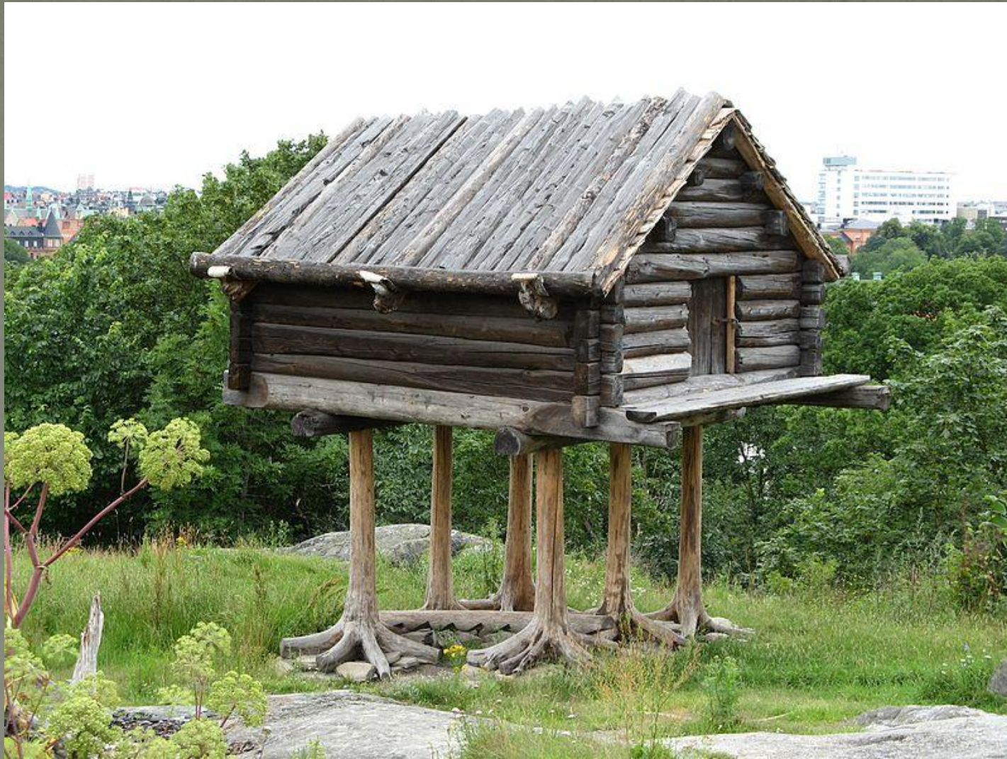
АМБАР У СААМОВ