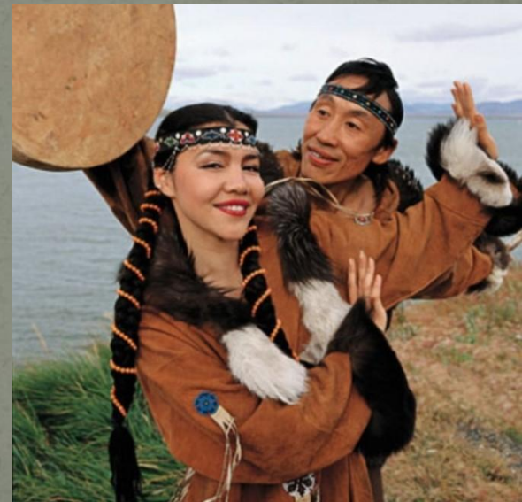
🔊 Чукотская песня