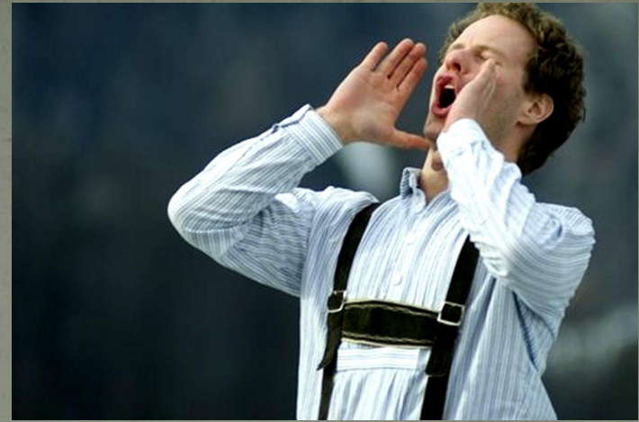
🔊 Тирольское пение