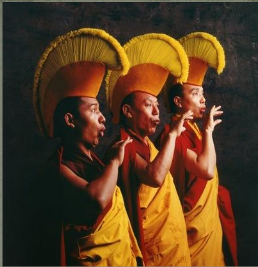
🔊 Тибетское горловое пение