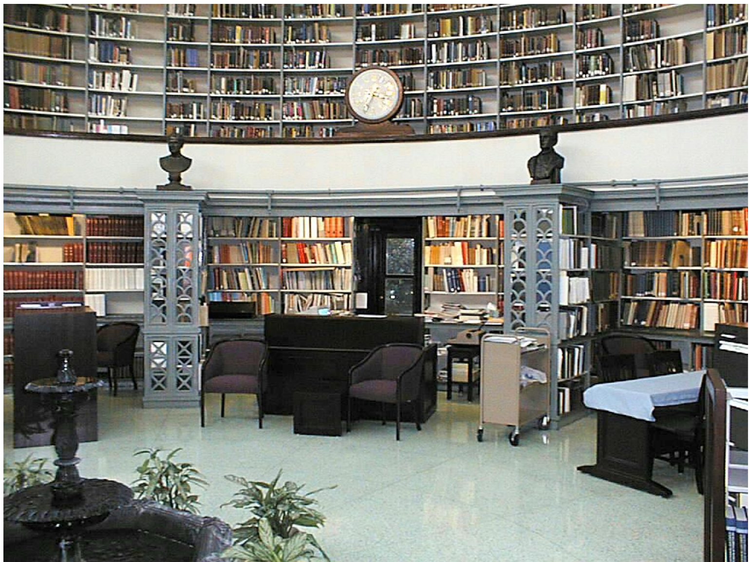
В этой библиотеке очень много книг, поэтому их расположили в несколько этажей.