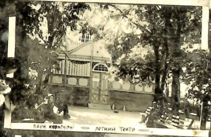
Парк культуры — Детский театр