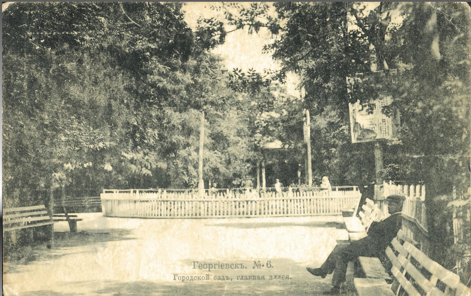
Георгиевскъ. №. 6. Городской садъ, главная аллея.