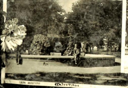
Парк культуры — Фонтан