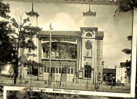
Синема — Кино театр