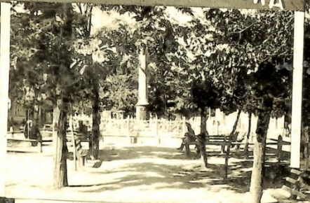
Обелиск — Памятник Борцам за свободу