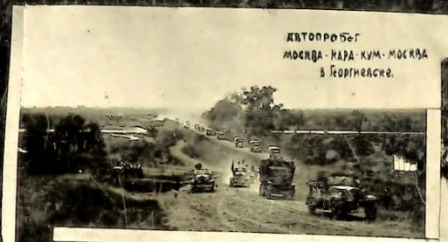
Автомобиль Москва - Париж - Москва в Георгиевске.