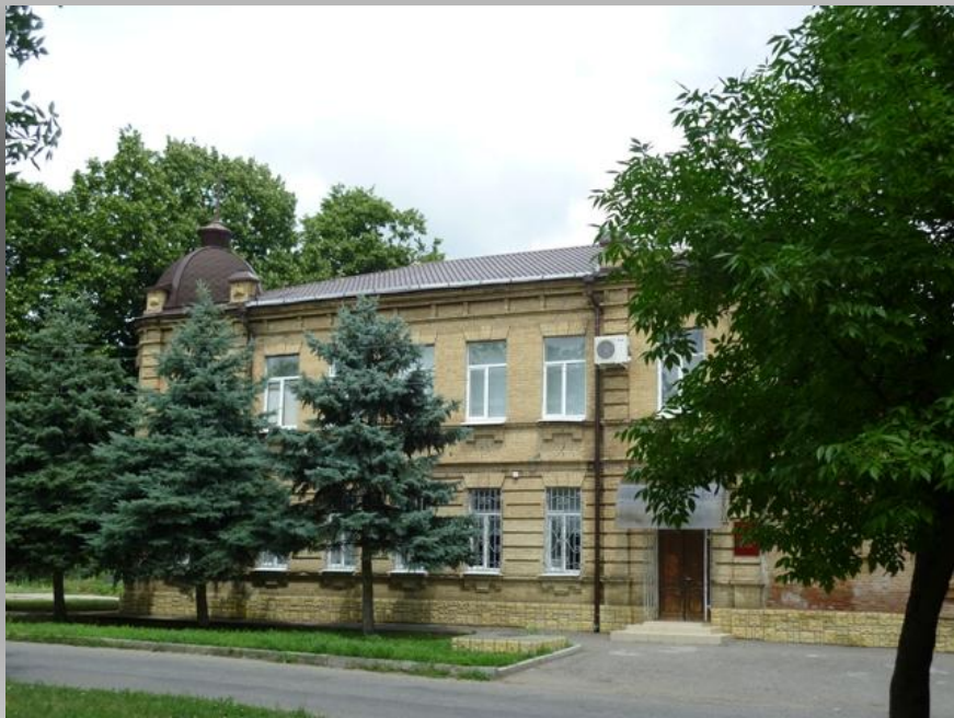
Городской дом культуры