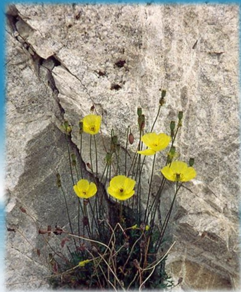
маки на байкальских скалах

На побережье Байкала произрастает около 2000 видов растений.