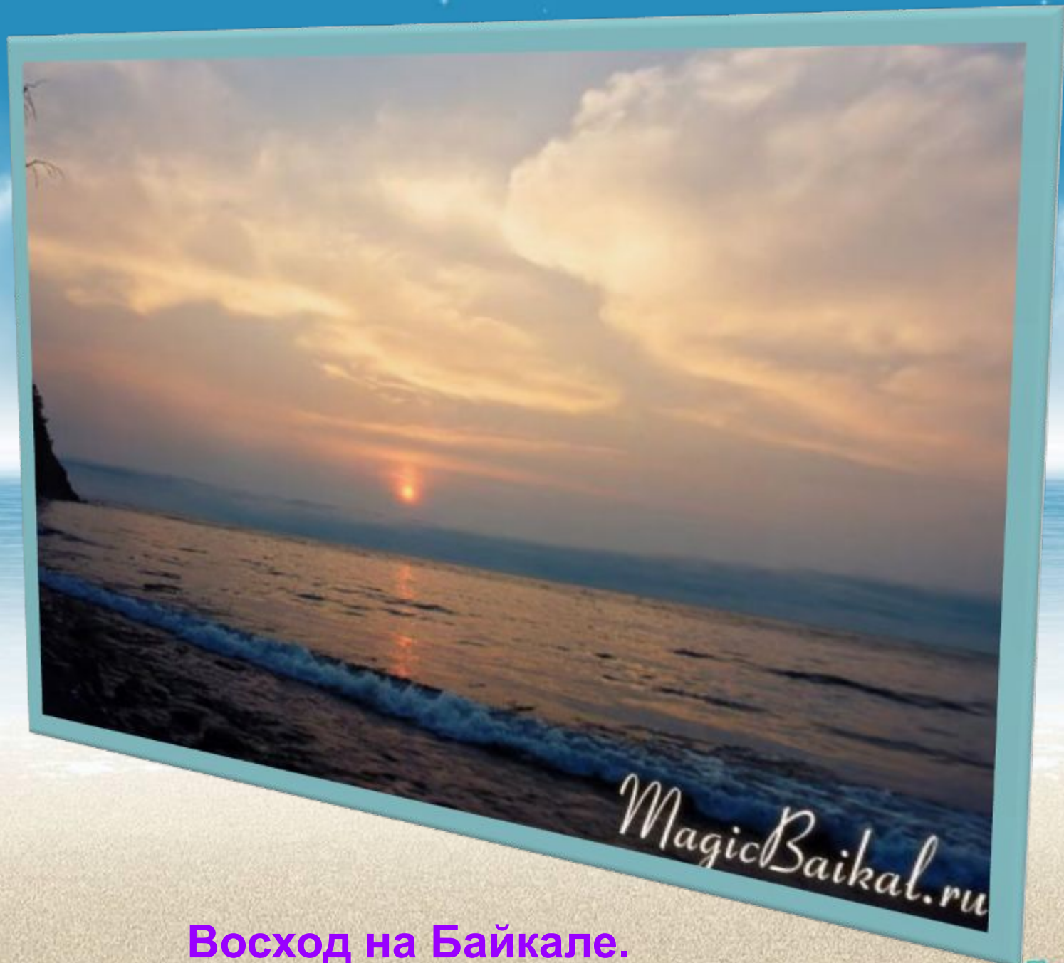
Восход на Байкале.