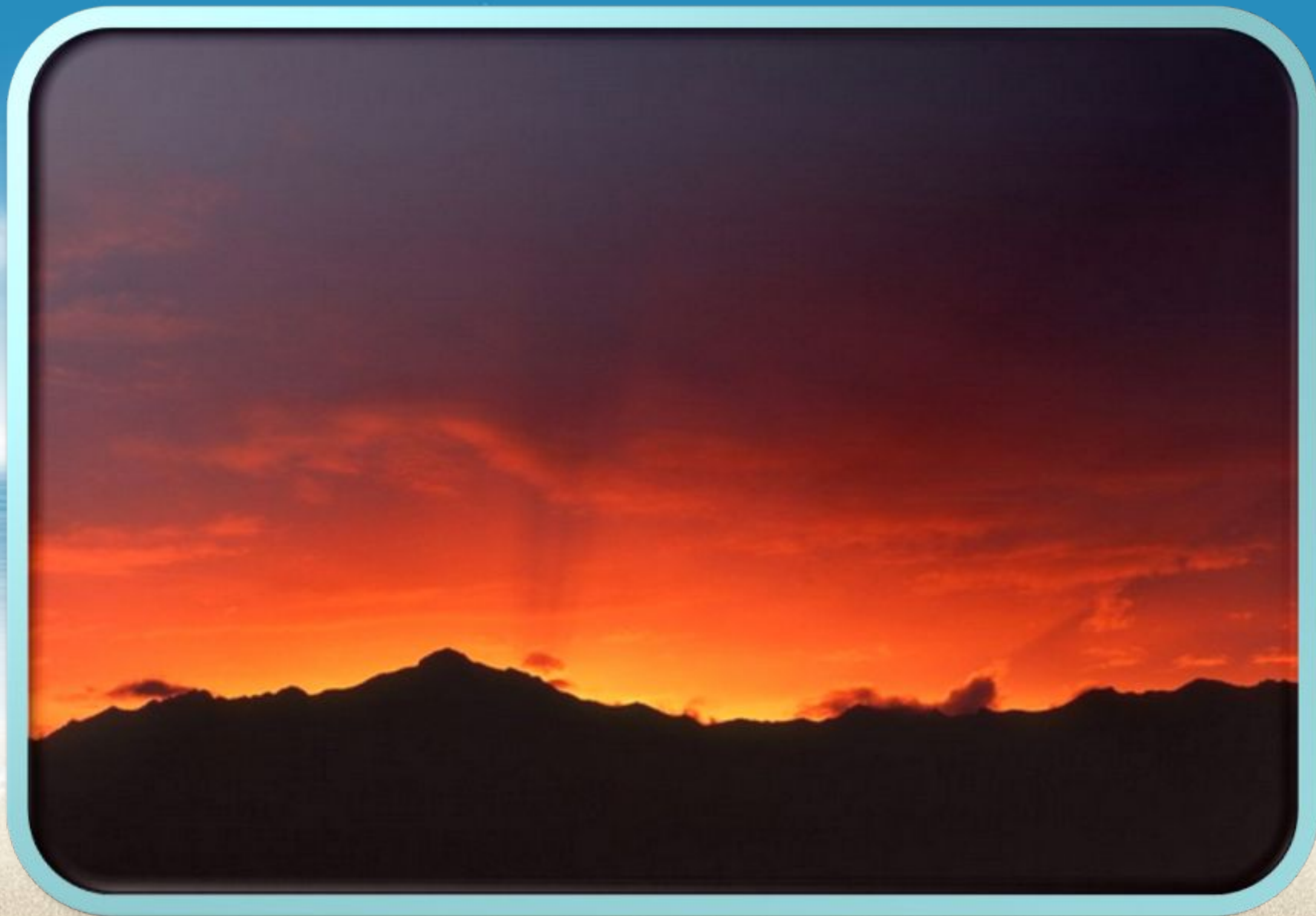
Баргузинский хребет на закате.