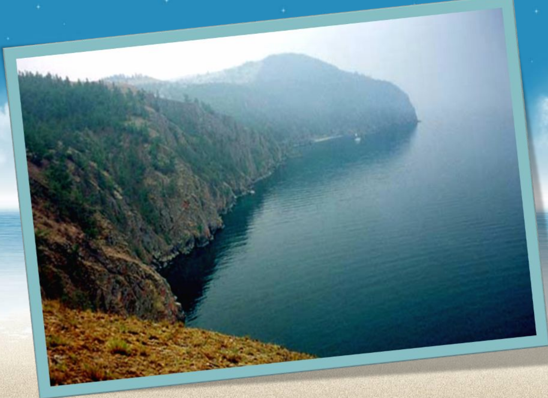
Байкал. Остров Ольхон.