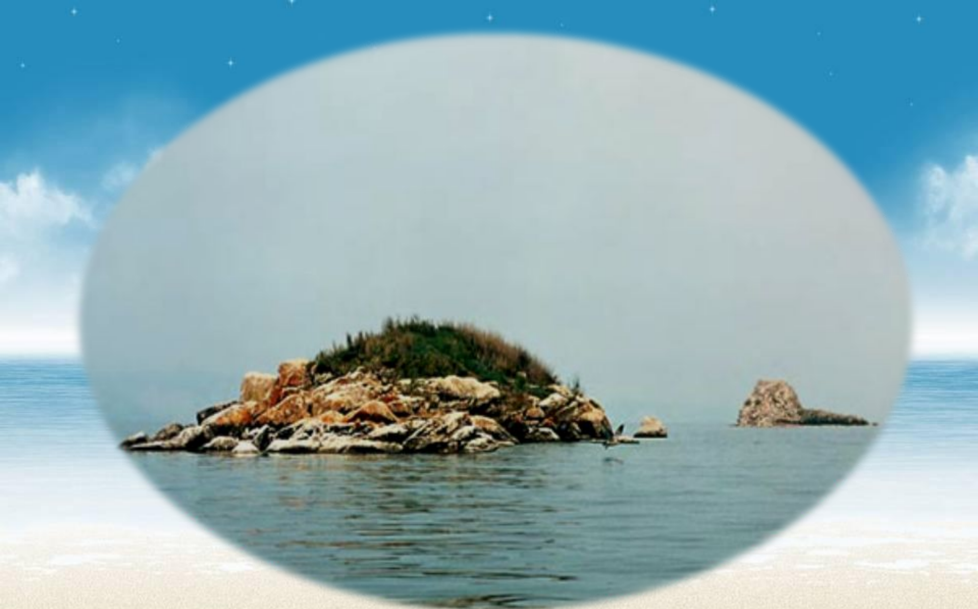
Байкал. Острова Модото и Едор.