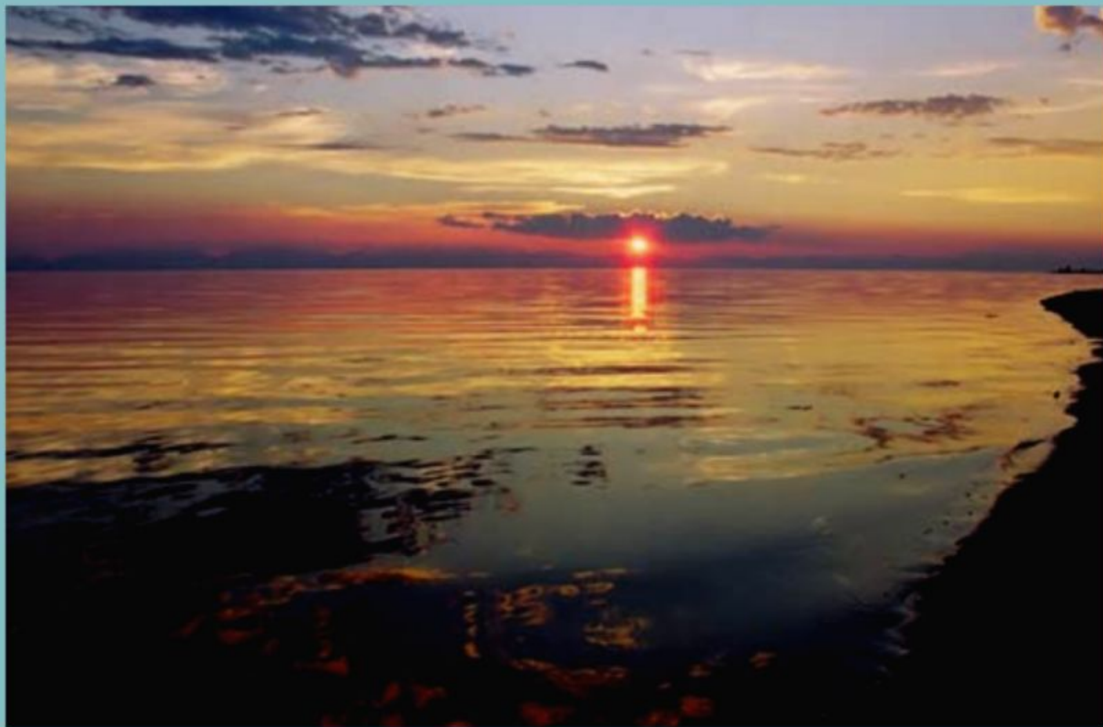
Заход солнца. Бухта Сосновка.