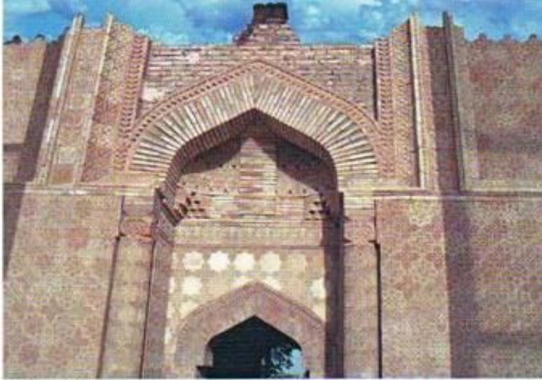
Мавзолей Айша-Биби. XII в.