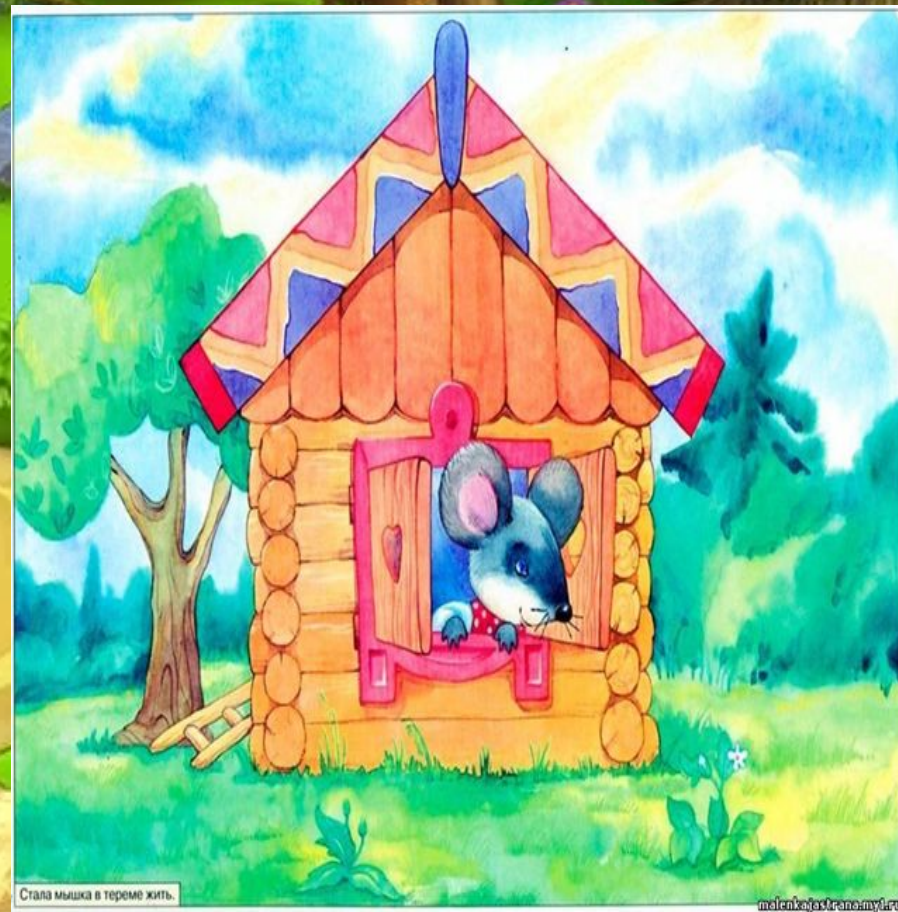
Стала мышка в тереме жить.