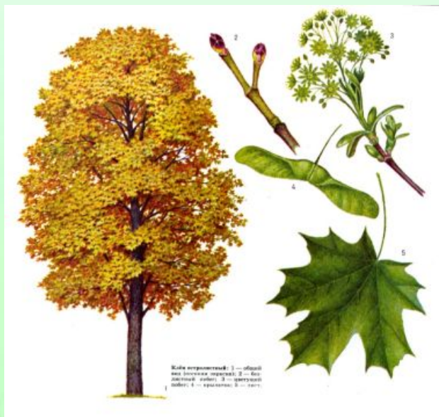
Клен остролистный: 1 — общий вид дерева осенью; 2 — крупный лист; 3 — цветочная ветвь; 4 — плод; 5 — черешок.