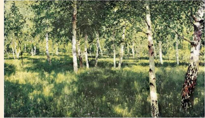
Исаак Левитан. Берёзовая роща.