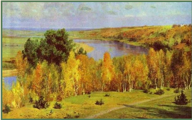
Василий Поленов. Золотая осень.