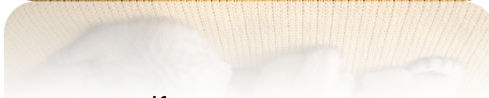
Кошка с котятами