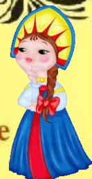
Русский академический хор имени Пятницкого