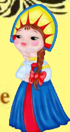
Русский академический хор имени Пятницкого