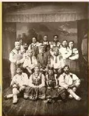
Митрофан Ефимович Пятницкий и его крестьянский хор