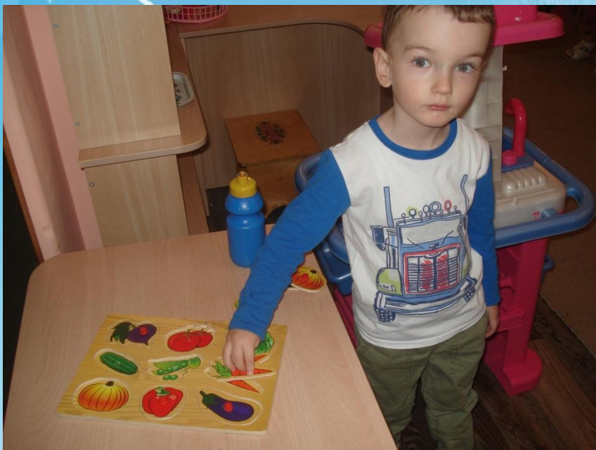
Пазлы – вкладыши «Овощи»