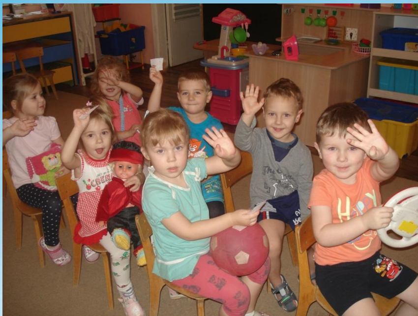
« Едем на автобусе»