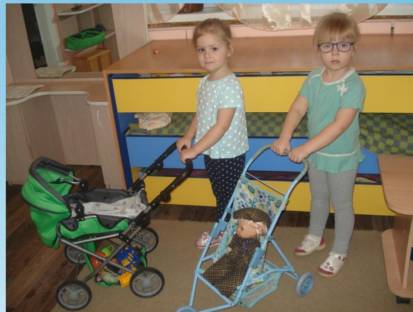
« Дочки – матери»