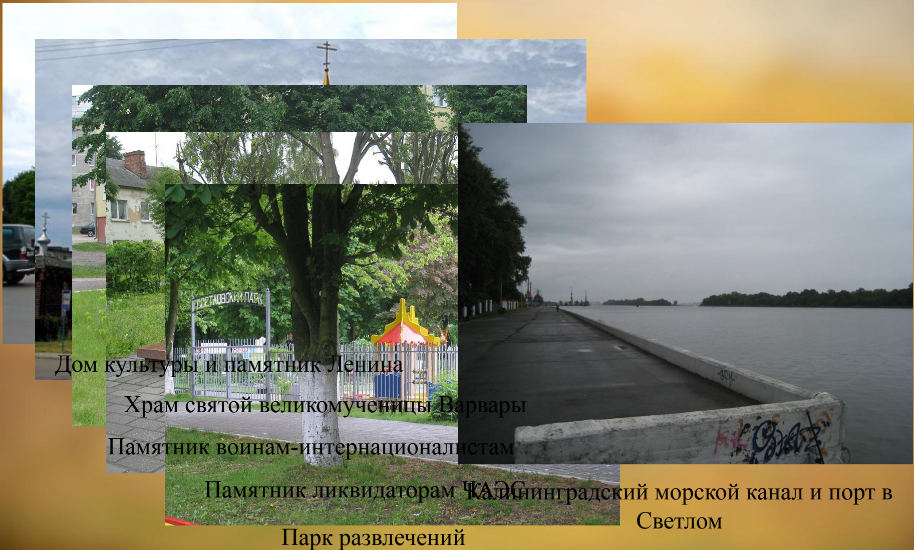
Дом культуры и памятник Ленину