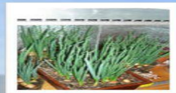
Луковички на 10-й день