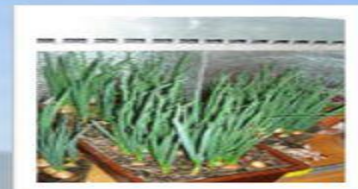
Луковички на 10-й день