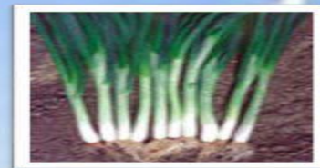
Хорош наш урожай!