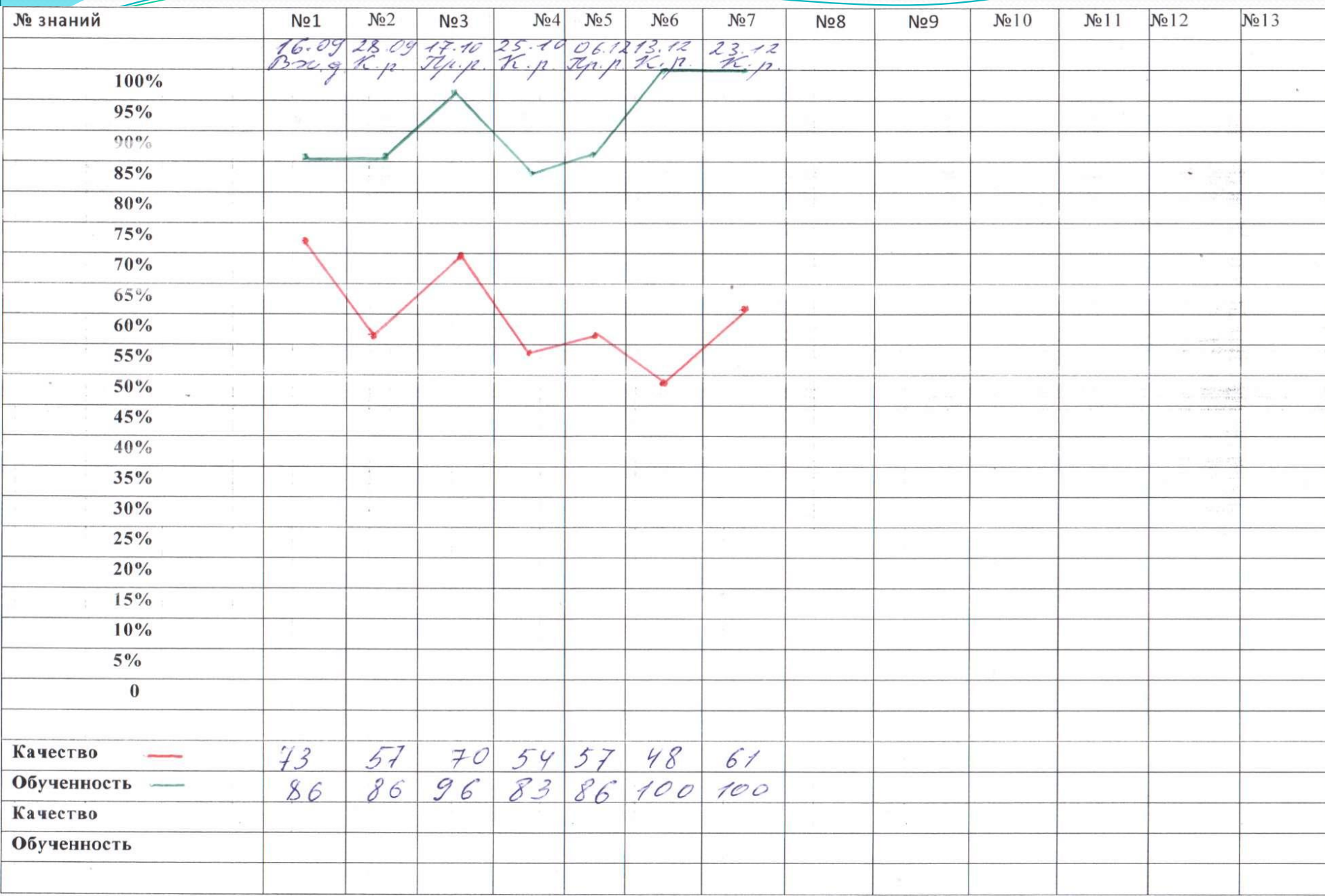
График проверочных и контрольных работ по математике во 2 Б классе