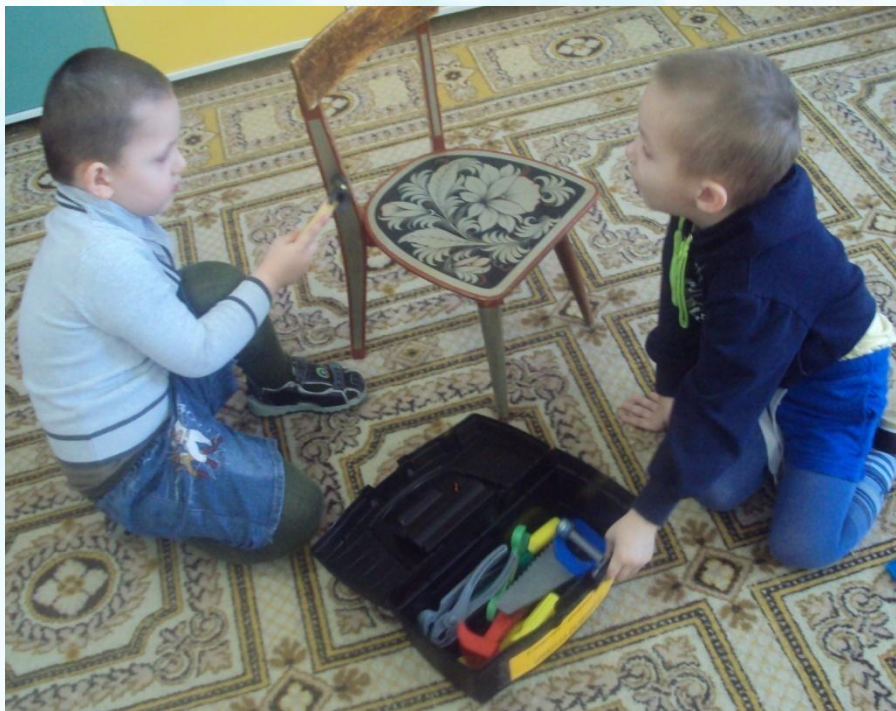
С/Р ИГРА «ШКОЛА РЕМОНТА»