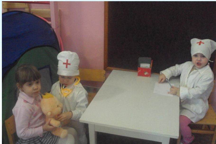
С/Р ИГРА «ПОЛИКЛИНИКА»